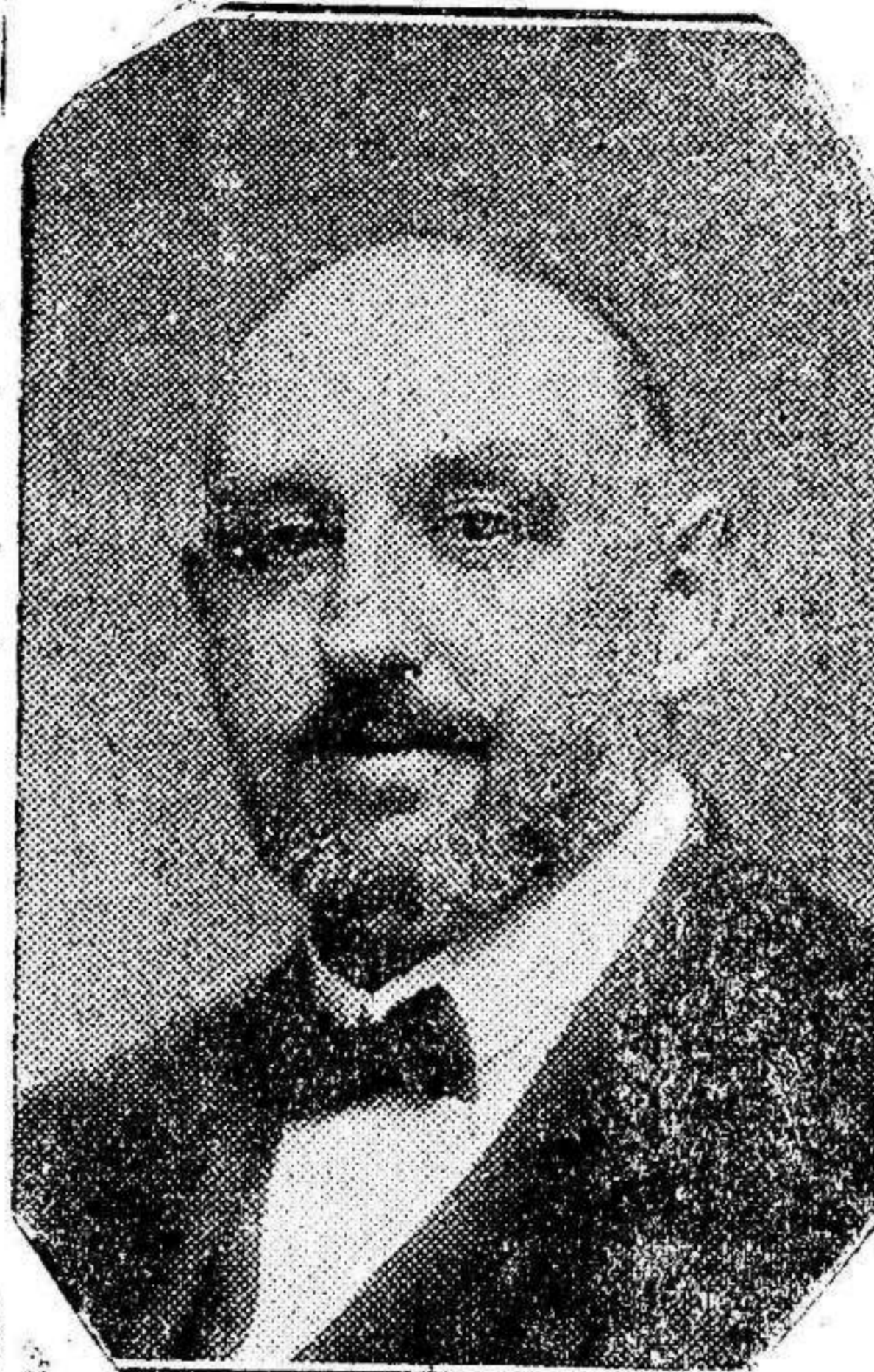
Don Angel Ossorio y Gallardo

pensamiento político? Juzga necesaria la propaganda? —Hay no uno, sino varios. Lo tienen socialistas y comunistas, lo tienen los regionalistas y los liberales y los católicos sociales y los republi-