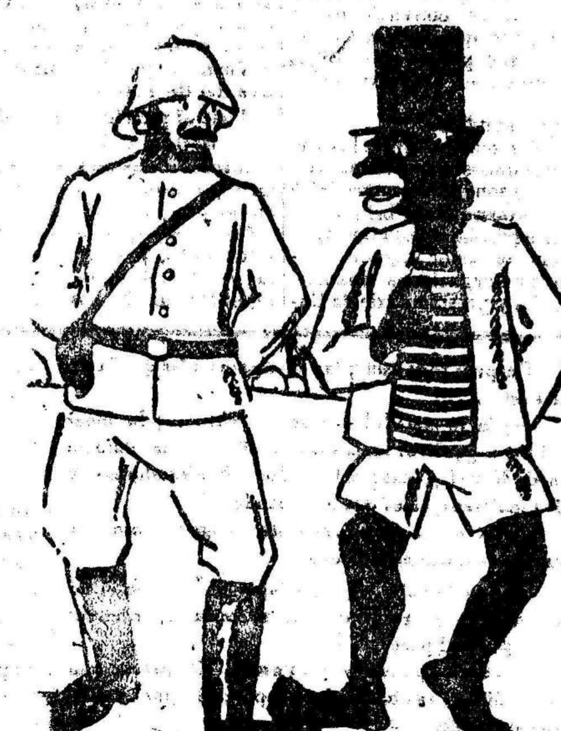
—Y, sin embargo, majestad, conozco bien a los hombres. Hace quince años que los mando. —¡Bahl! Mejor los conozco yo, que hace cuarenta años que me los cobro.