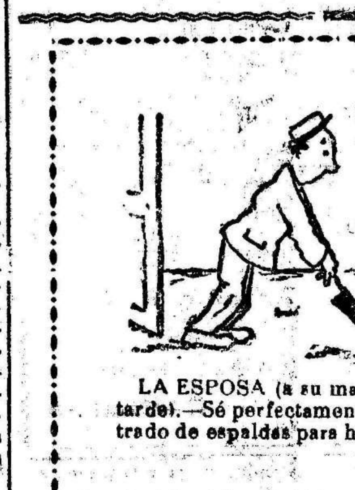
LA ESPOSA (a su marido, que ha llegado muy tarde).—Sé perfectamente la hora que es. Tu has entrado de espaldas para hacerme creer que salías...

Una compañía del regimiento infantería de Murcia con baidera, música y banda de cohetes rindió los honores de ordenanza a la llegada del ministro, y al entrar el