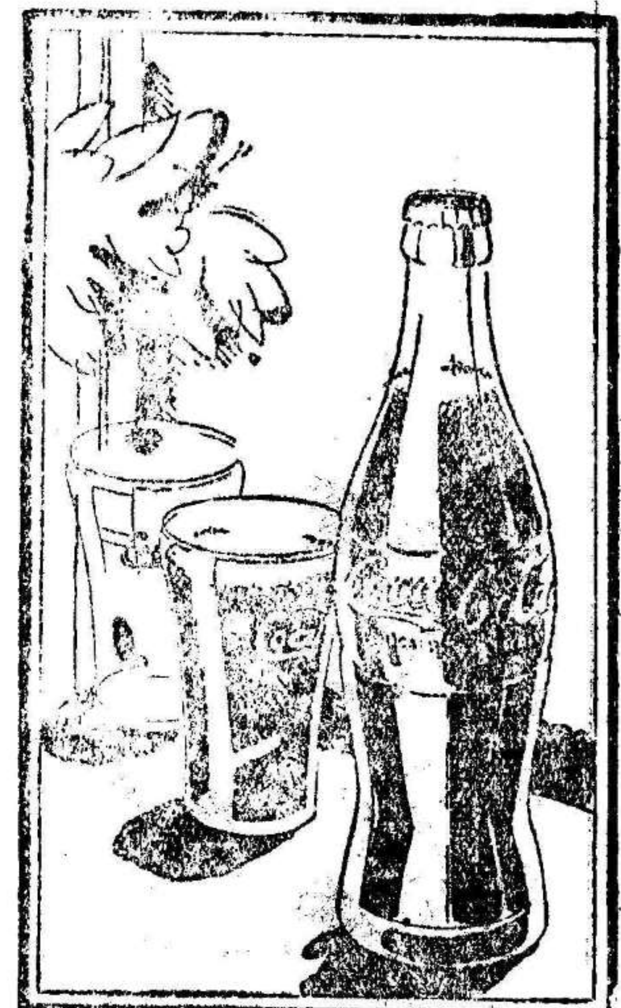
En esta bebida encontrará usted un sabor nuevo y diferente a todos los conocidos

ANTES de probarla, las personas expertas en el conocimiento de bebidas exóticas creían imposible que hubiese una — compuesta sólo de frutas — cuyo gusto sedujese por exquisito y desconocido Coca-Cola, la bebida de fama mundial — ahora de venta aquí — vino a convencerlos de lo contrario