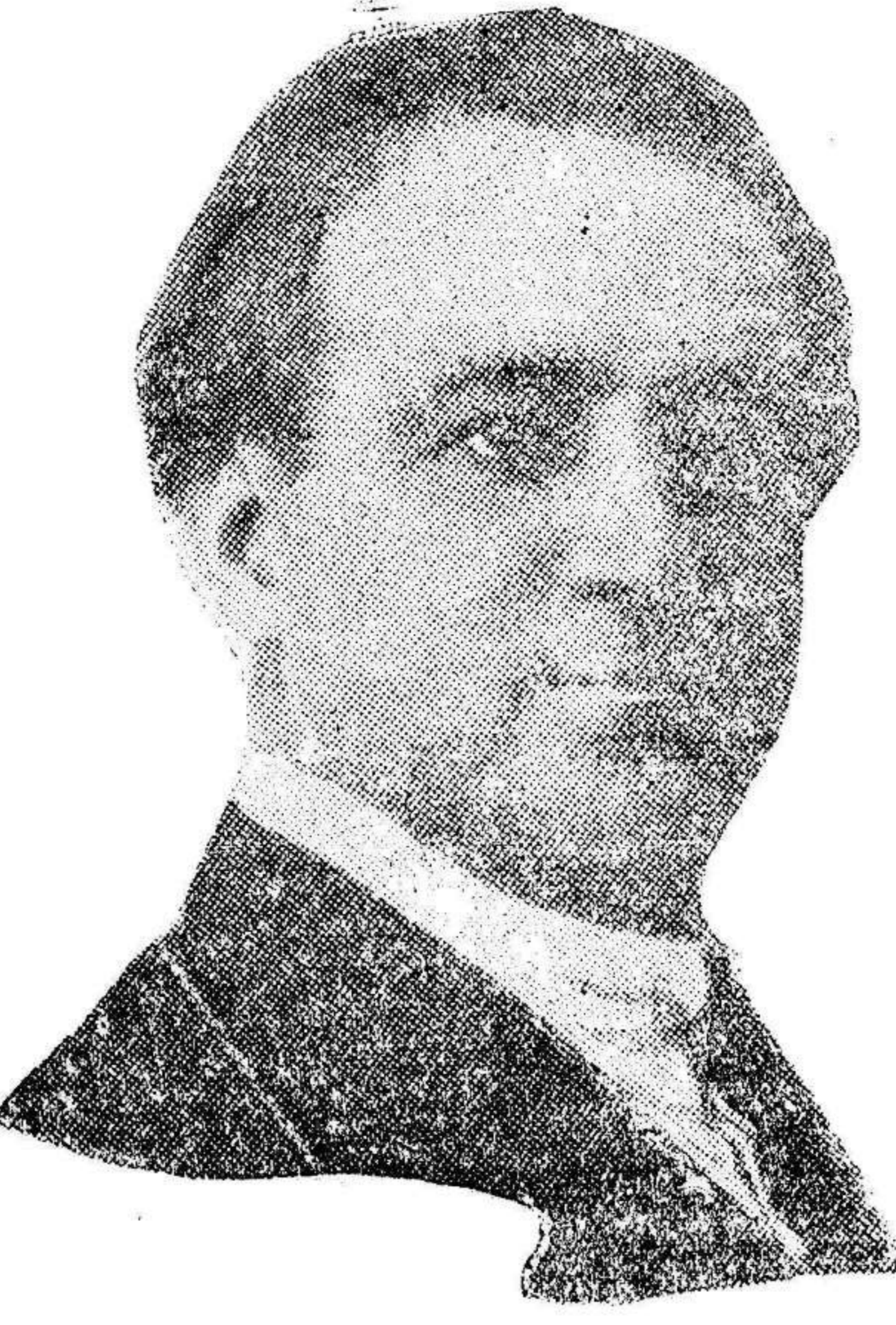
Hipólito Lázaro, que en breve actuará por primera vez en nuestra ciudad, cantando «Marina» en la Plaza de Toros.