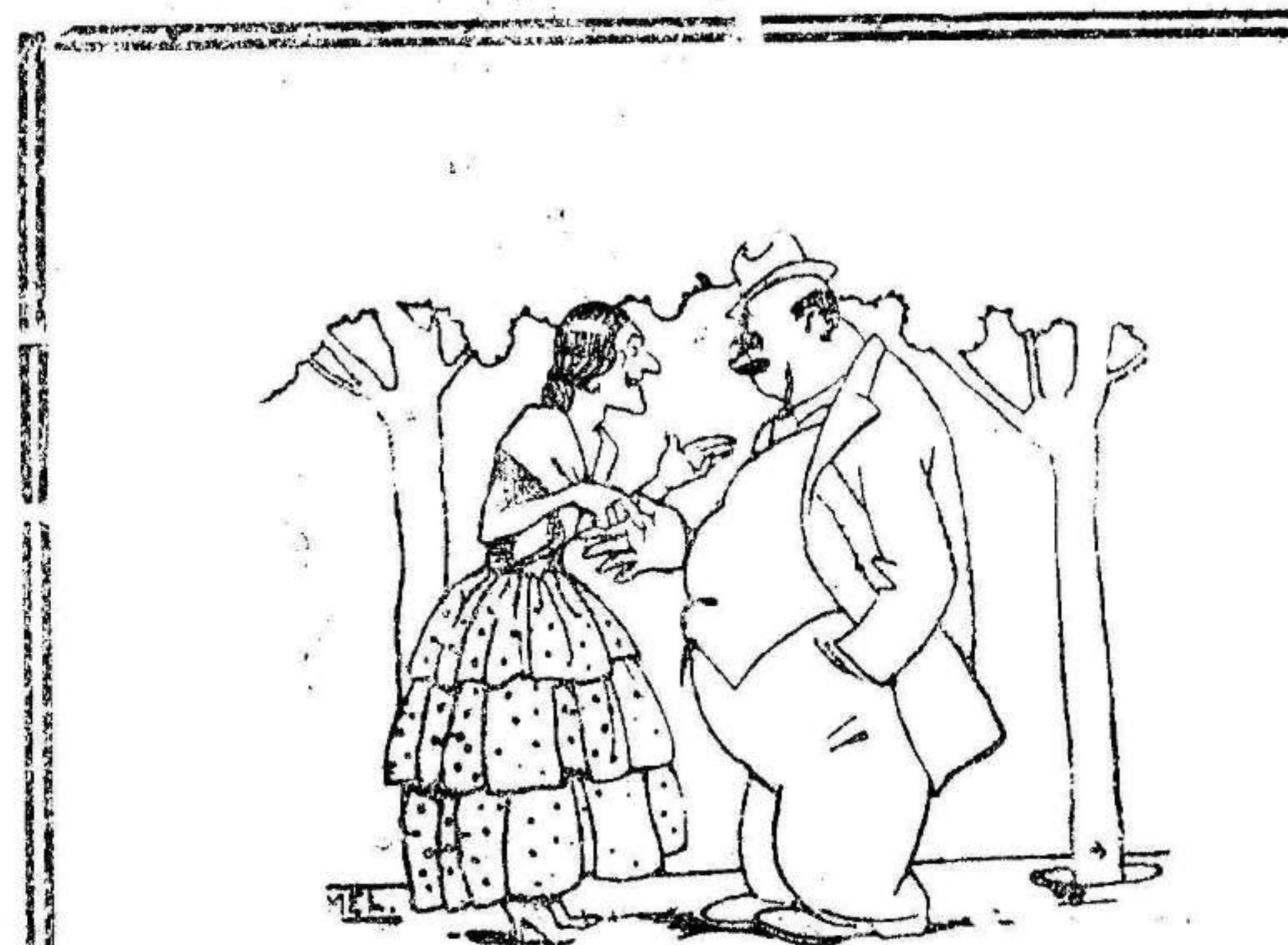
—¿Tú estás haciendo pensar a una princesa rubia por tu tipo ¡carando-o y tus pstitas de bailar! (Nervión.)