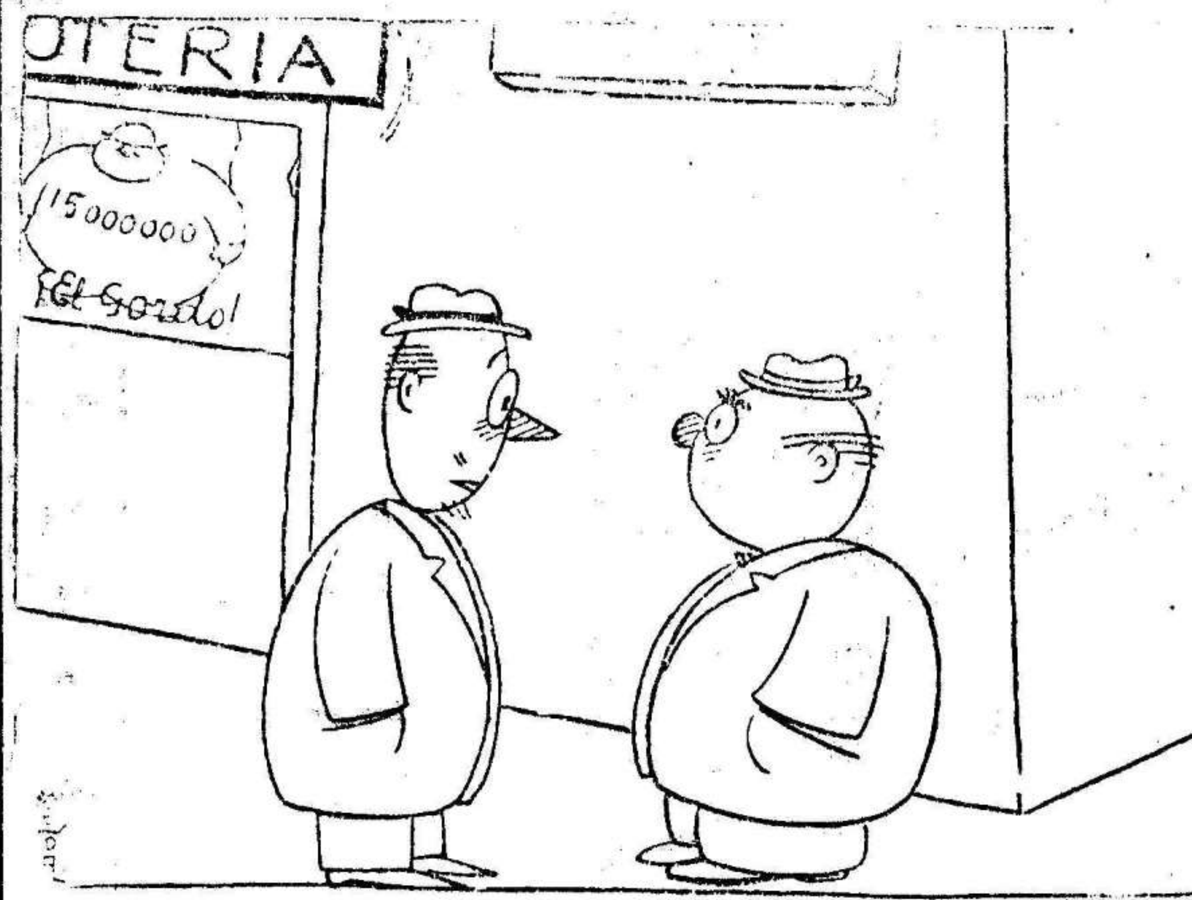
MAL DE MUCHOS... —Dentro de unos años, todos calvos!