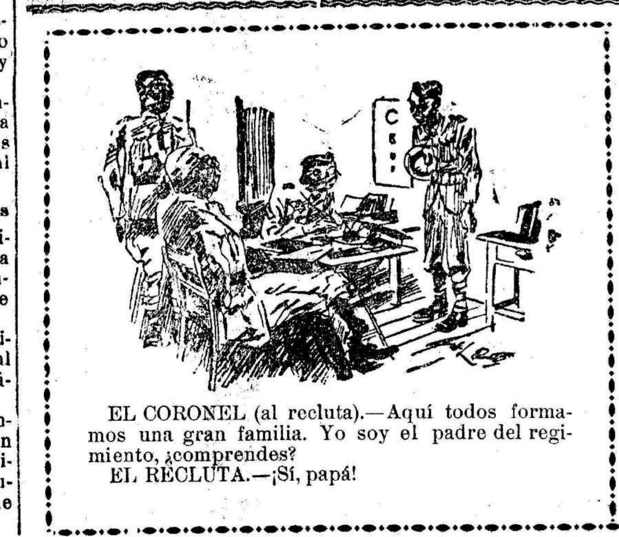
EL CORONEL (al recluta).—Aquí todos formamos una gran familia. Yo soy el padre del recluta, ¿comprendes? EL RECLUTA.—¡Sí, papá!