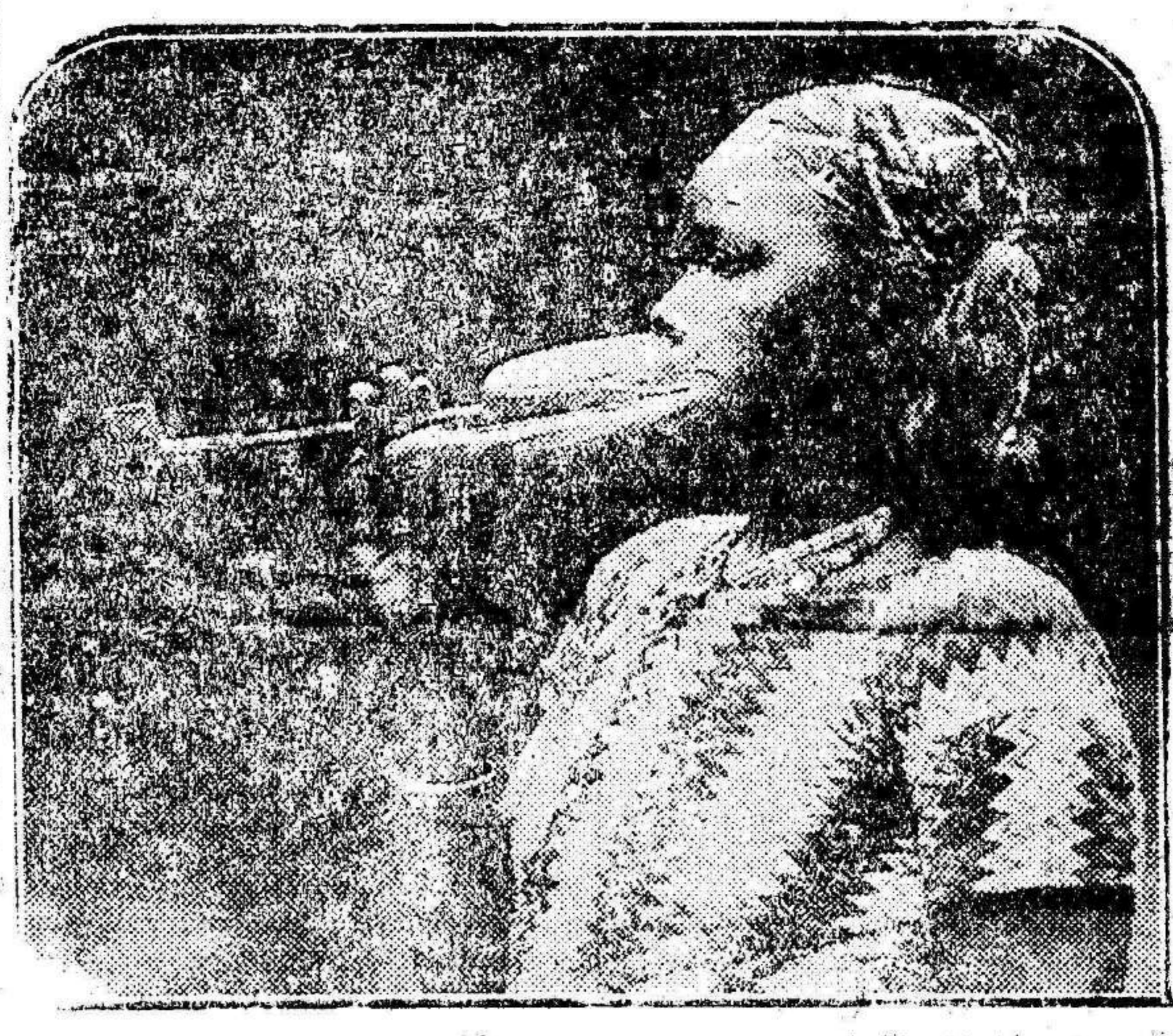
Una de las negras progratas que se exhiben en el Jardín de Aclimatación de París.

En cuanto a sus contumaces insidias, más caen sobre él que sobre nosotros. De sobra conoce la región nuestra conductiva y sabe que estamos tan lejos de Cierva como del socialismo burocrático de Saborit. Menos mal que no somos los únicos. Hasta el glorioso «Heliófilo», el ático periodista de las «Charlas al Sol» ha tenido que sufrir sus impertinencias. No espero sin embargo «El Socialista» que le apliquemos la ley de Tallón. No nos gusta manejar la injuria. Sin embargo no nos lo agradezco. Es un problema de sensibilidad y de propia estimación. Su proceder no es acreedor al respeto y sin embargo ya ve cómo le guardamos esas consideraciones que de manera tan innoble nos atribuye hacia el señor Cierva.