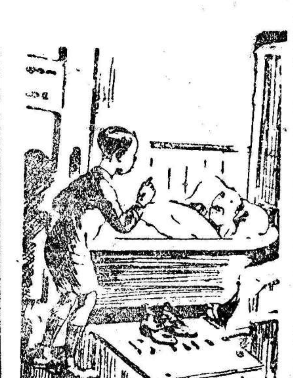
EL MUCHACHO (hijo de la propietaria de la pensión)...

«Mamá me encarga que le diga no haga ruido al levantarse temprano mañana por la mañana.»