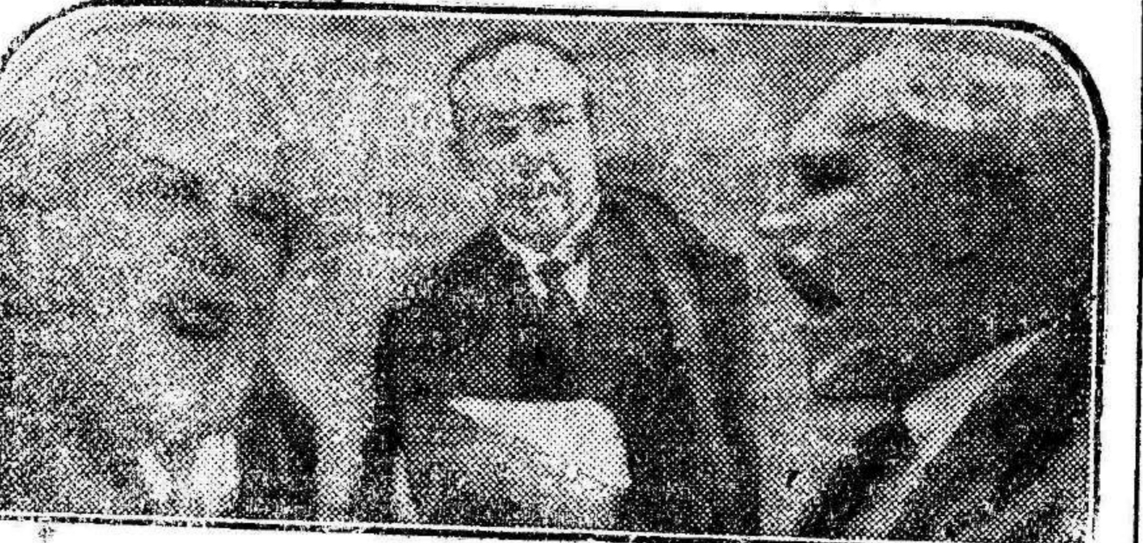
De izquierda a derecha: Lloyd George, Mister Baldwin y Ramsay Maedonal, jefes de los partidos liberal, conservador y laborista respectivamente, que han contenido en las recientes elecciones inglesas y en las que el cuerpo electoral ha dado el triunfo a las huestes del último.