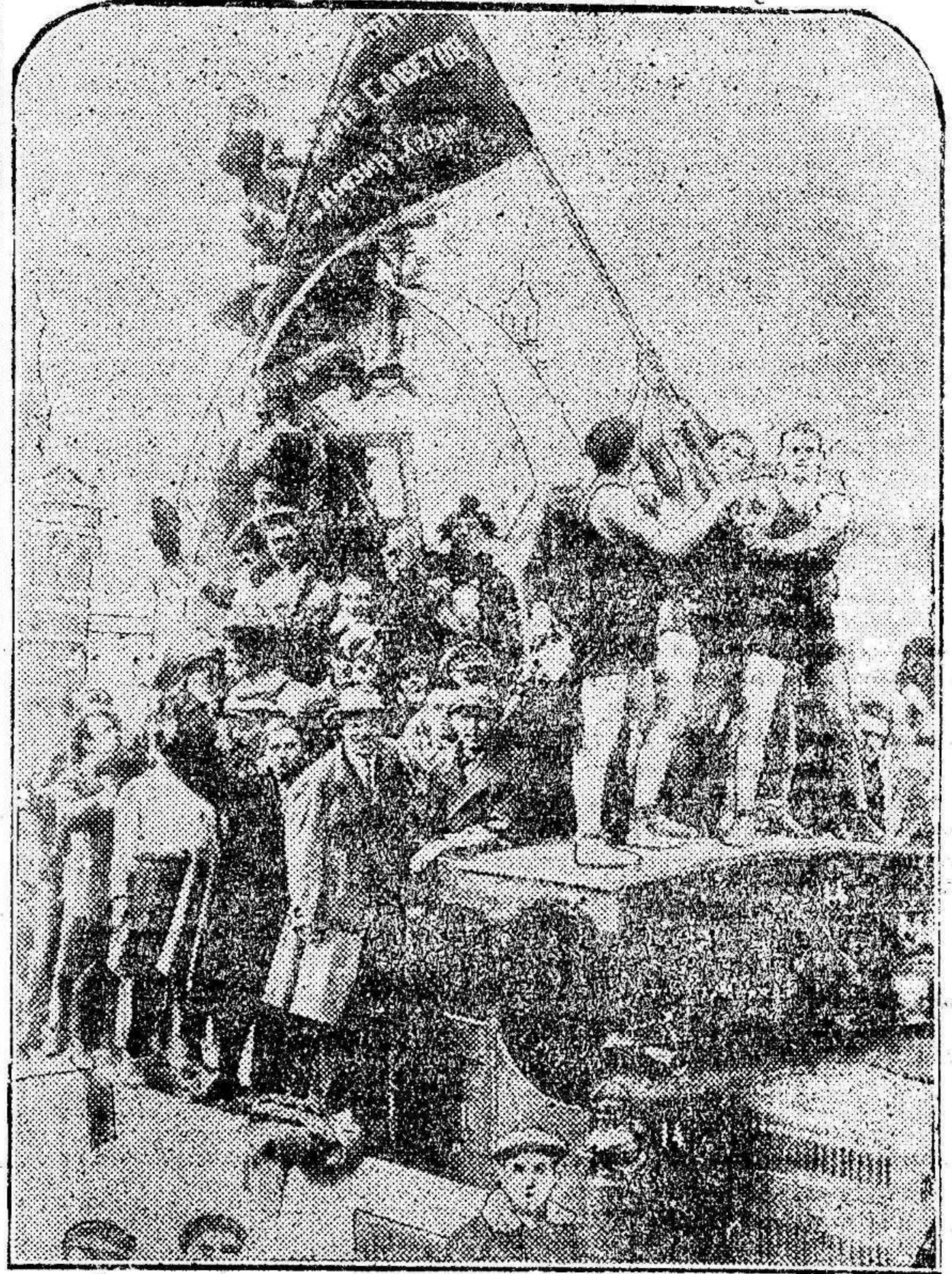
LA FIESTA DEL TRABAJO EN MOSCÚ.—Un grupo de proletarios celebrando alegremente el día del Trabajo, que ha revestido este año en la capital de los Soviets un inusitado regocijo.