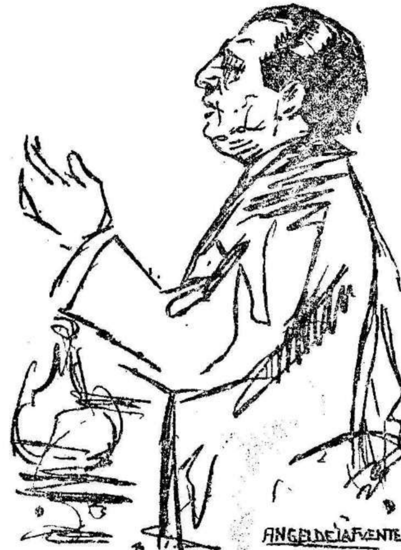
El insigne penalista don Luis Jiménez Asúa. (Visto por Angel de la Fuente)

El ilustre profesor estudió detenidamente la culpa como figura de delito en todos los Códigos europeos y en el nuevo Código Penal español, exponiendo su juicio acerca de las grandes catástrofes que conmovieron a España en el pasado otoño y es el de que si el hombre pudo evitarlas se deducen de aquellas grandes responsabilidades, aunque prácticamente no puedan ser exigidas.