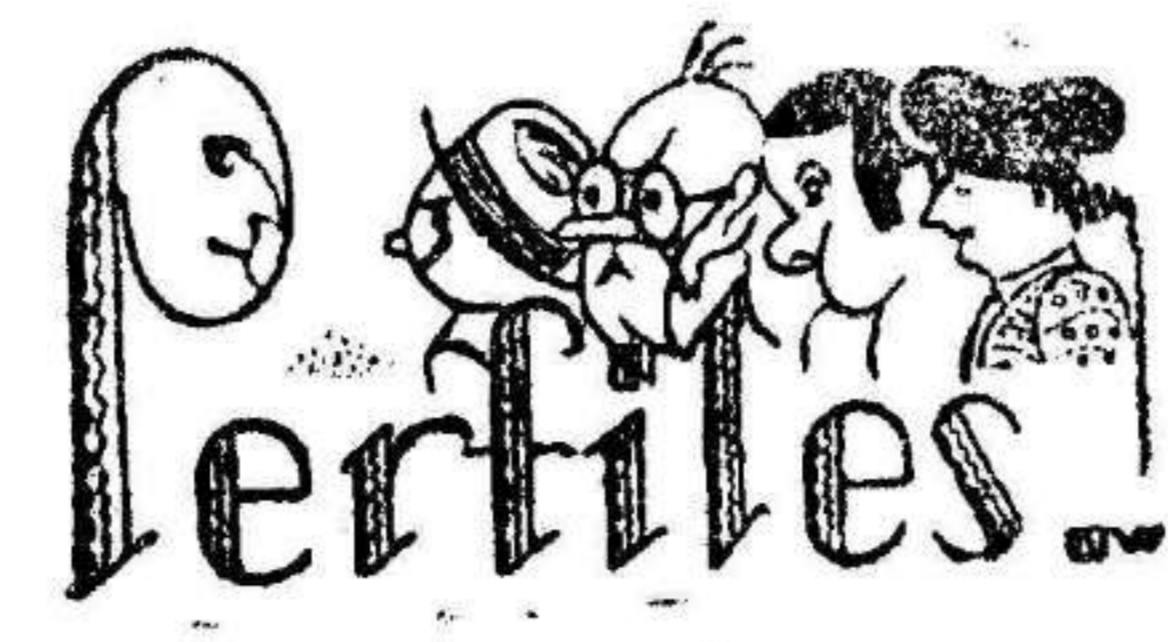
Con el apellido basta

proteger a la industria pimentonera se llegó a gravar en el arancel el pimentón extranjero. (Grandes risas). La culpa de ello ha sido de los productores e industriales. Al instituirse el Consejo de la Economía Nacional se dió el caso de que la riqueza agrícola no tuviera representación en dicho organismo.