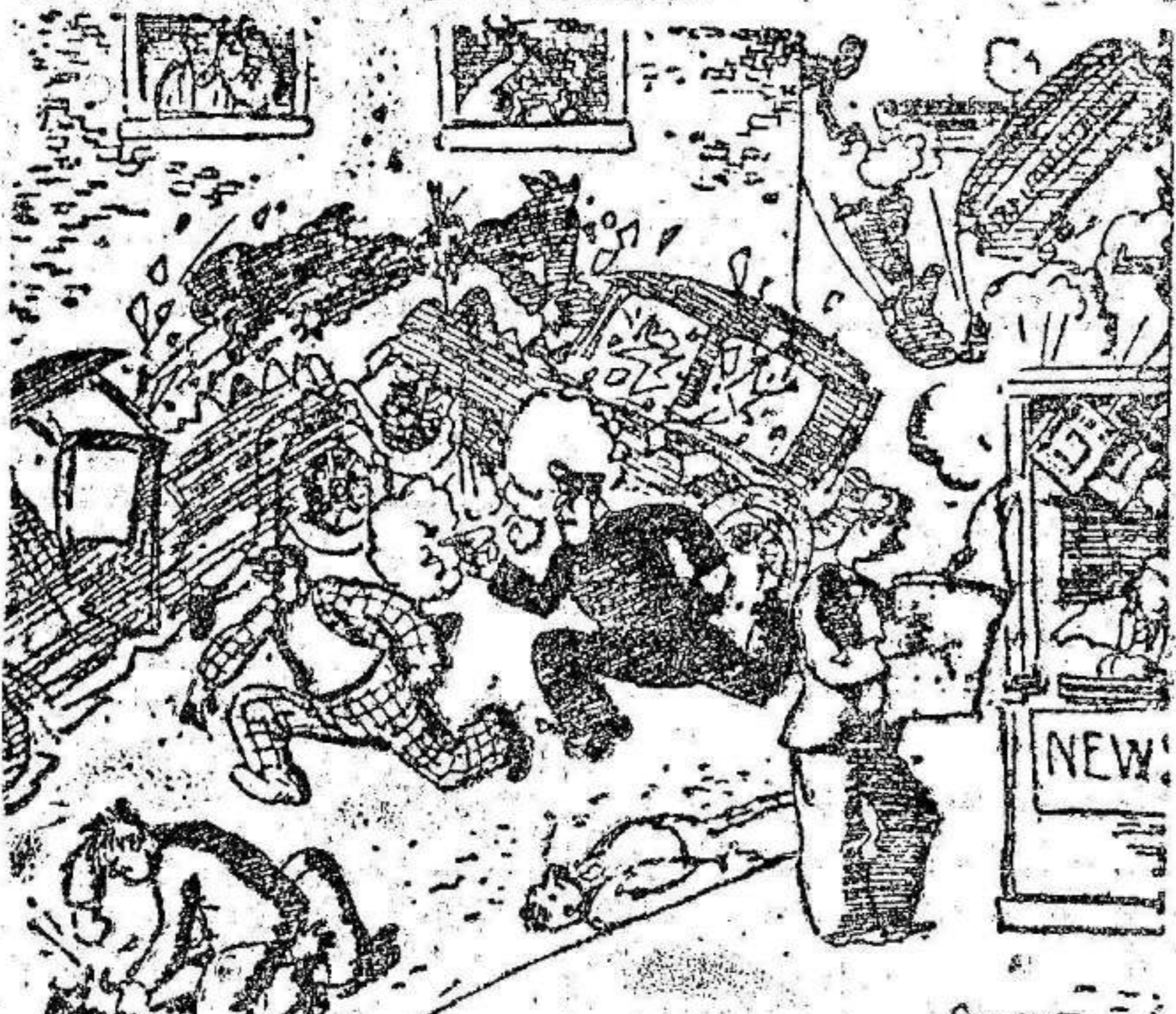
EL HABITANTE DE CHICAGO (comprado un periódico).—A ver si trae algún suceso palpitante.

—¿Sabe usted que Dalí llamó en una conferencia «putrefactos» a los pintores españoles? —El también está putrefacto. Con la desventaja, quizá, de no saberlo. —Ha dicho usted, también, ¿Es que usted no cree que el arte