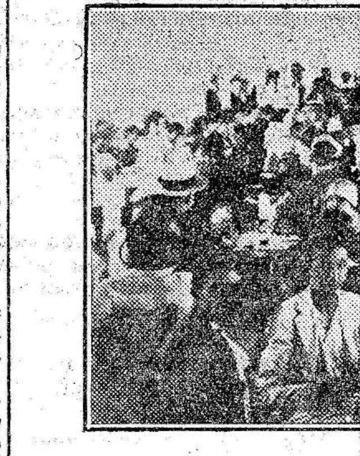
Para darse cuenta de la animación que existe en Aguilas, basta ver este aspecto de uno de sus más importantes balnearios.