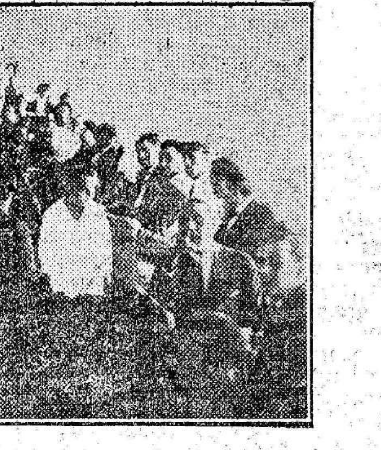
Botijistas madrileños