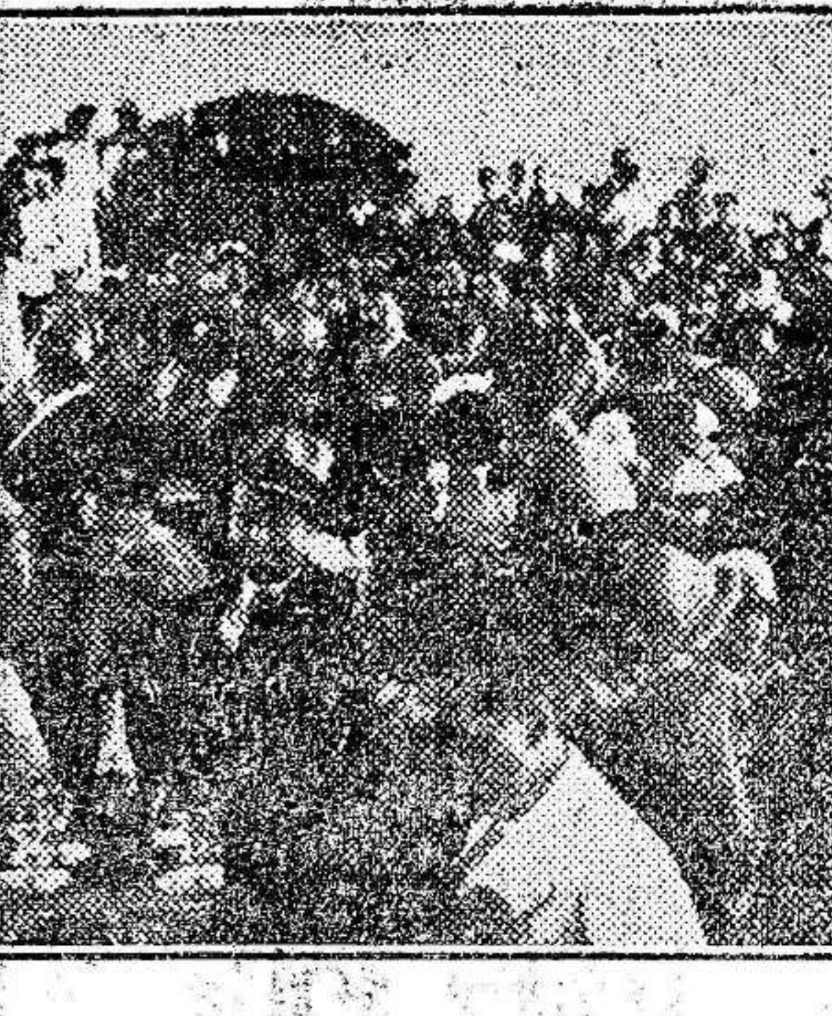
Escenas del baño

El día es sencillamente espléndido. Mucho sol, mucha luz y tal vez excesiva algarabía. El verano con su cortejo riante y vociferante, pone un matiz brillante al grisáceo palor de la primavera.