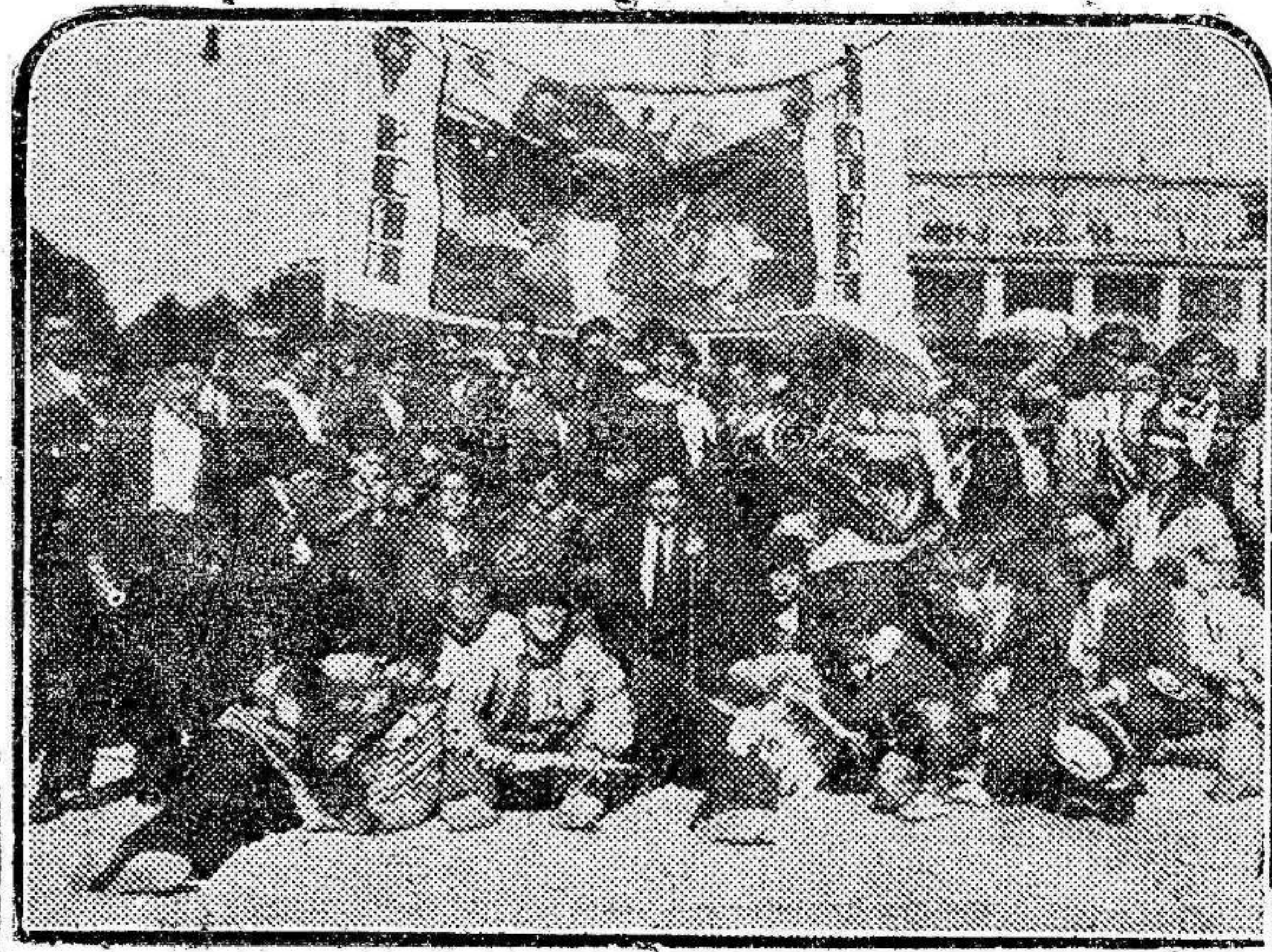
PAMPLONA EN FIESTAS.—La «Peña Indarra», una de las más típicas.

Entremeses variados; mojete superior; ternera a la cremasier; más ternera, a la chipén; otro plato más de ternera a la derniere chupiere ; pollo pintado