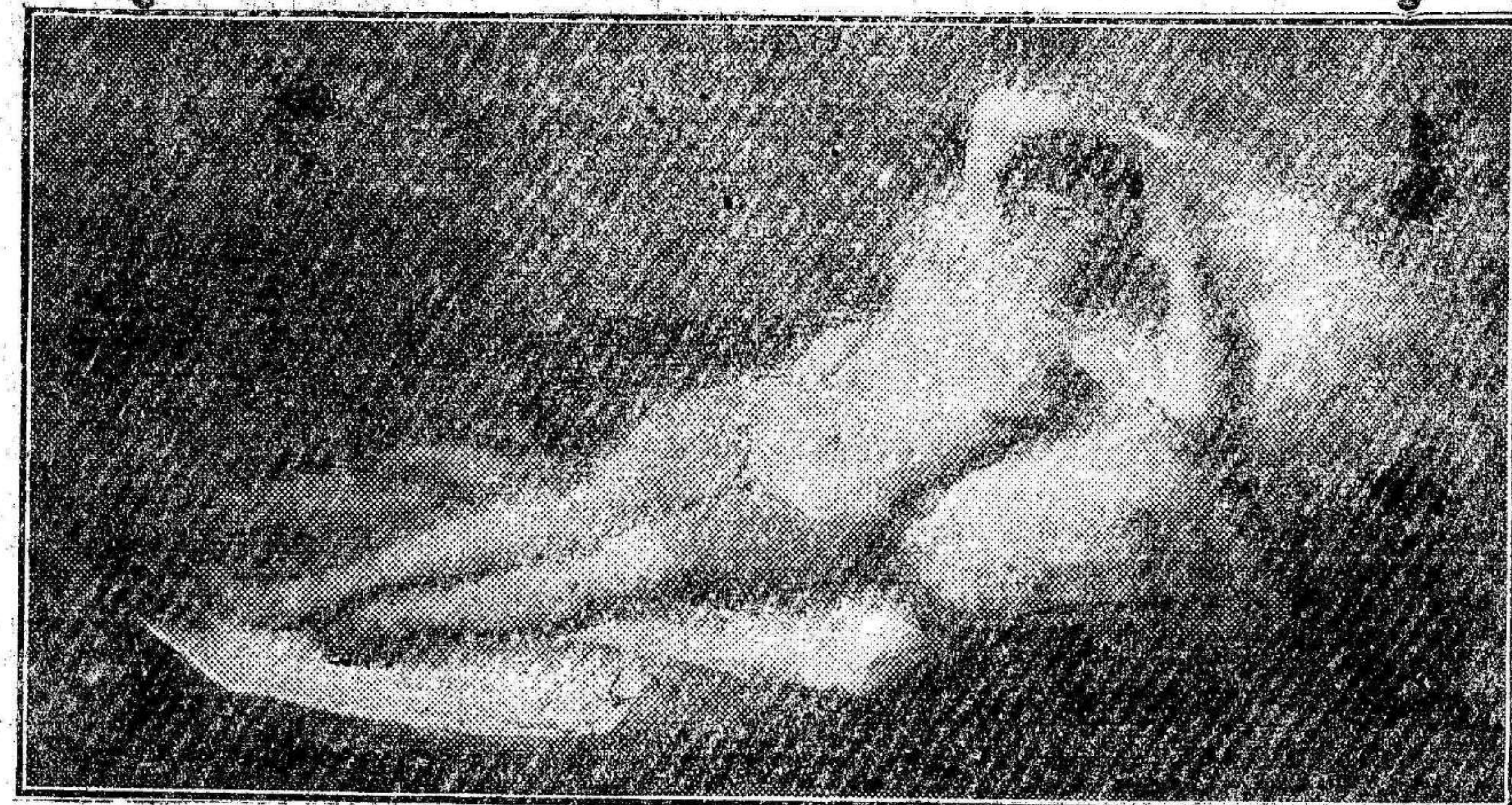
«LA MAJA DESNUDA». Una de las obras inmortales de Goya

de reducir a tres lecciones todo el proceso estético de Goya. Pero, ha de tenerse en cuenta que estas conferencias no son biográficas, ni críticas, sino solo comentarios, notas al margen de los cuadros del gran pintor español.