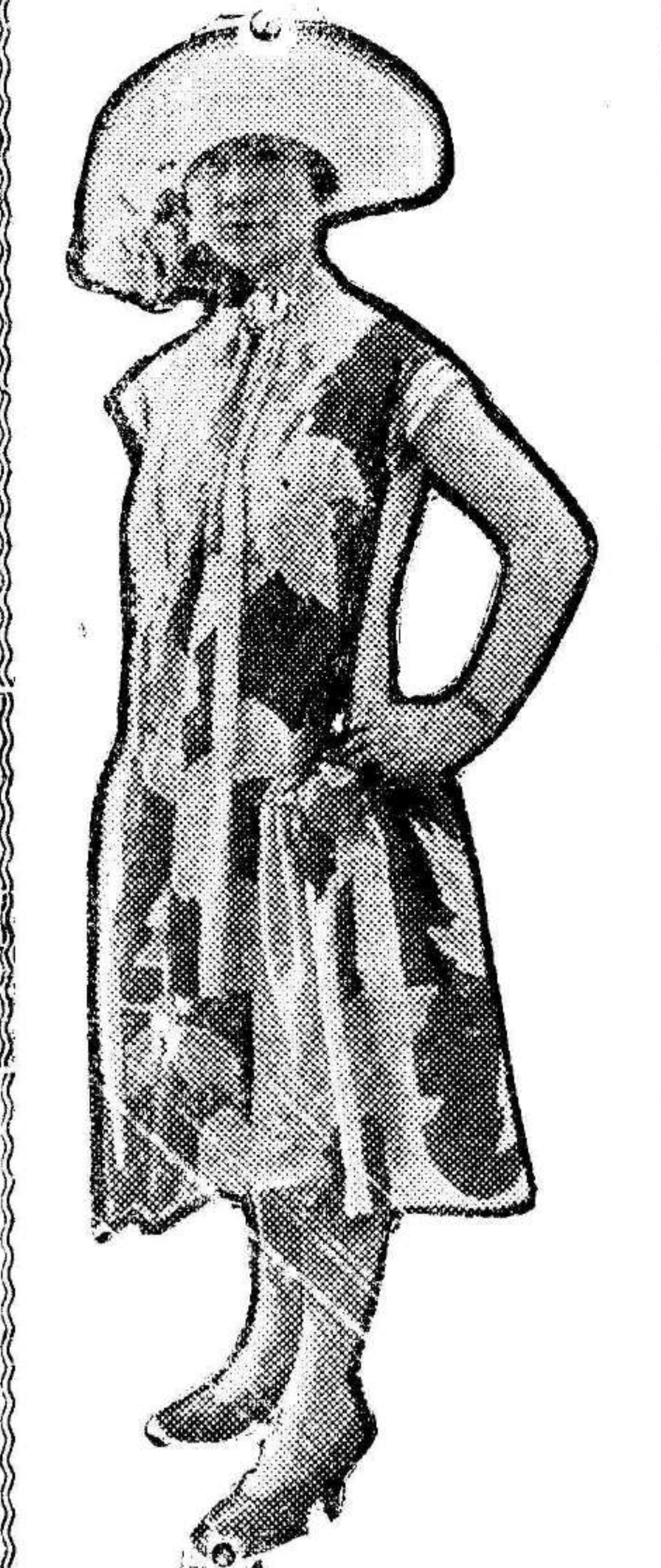
Precioso y elegante vestido de verano, reciente creación de los modistos parisenses.