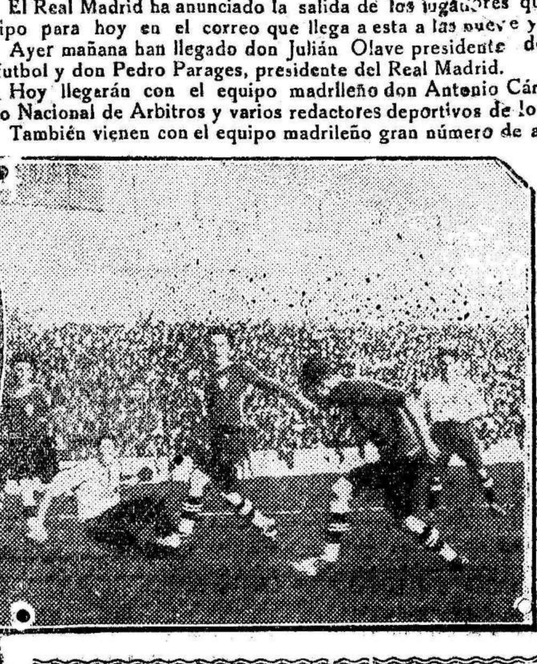
Ante la contienda a desarrollar entre madrileños y murcianos, hoy recobran actualidad estos momentos interesantísimos que reflejan la lucha entre los equipos Real Madrid y Real Murcia, en ocasión del partido jugado por el Real Murcia en el campo de Chamartín

leño hacia los jugadores del Real Murcia en la visita de este equipo a Madrid.