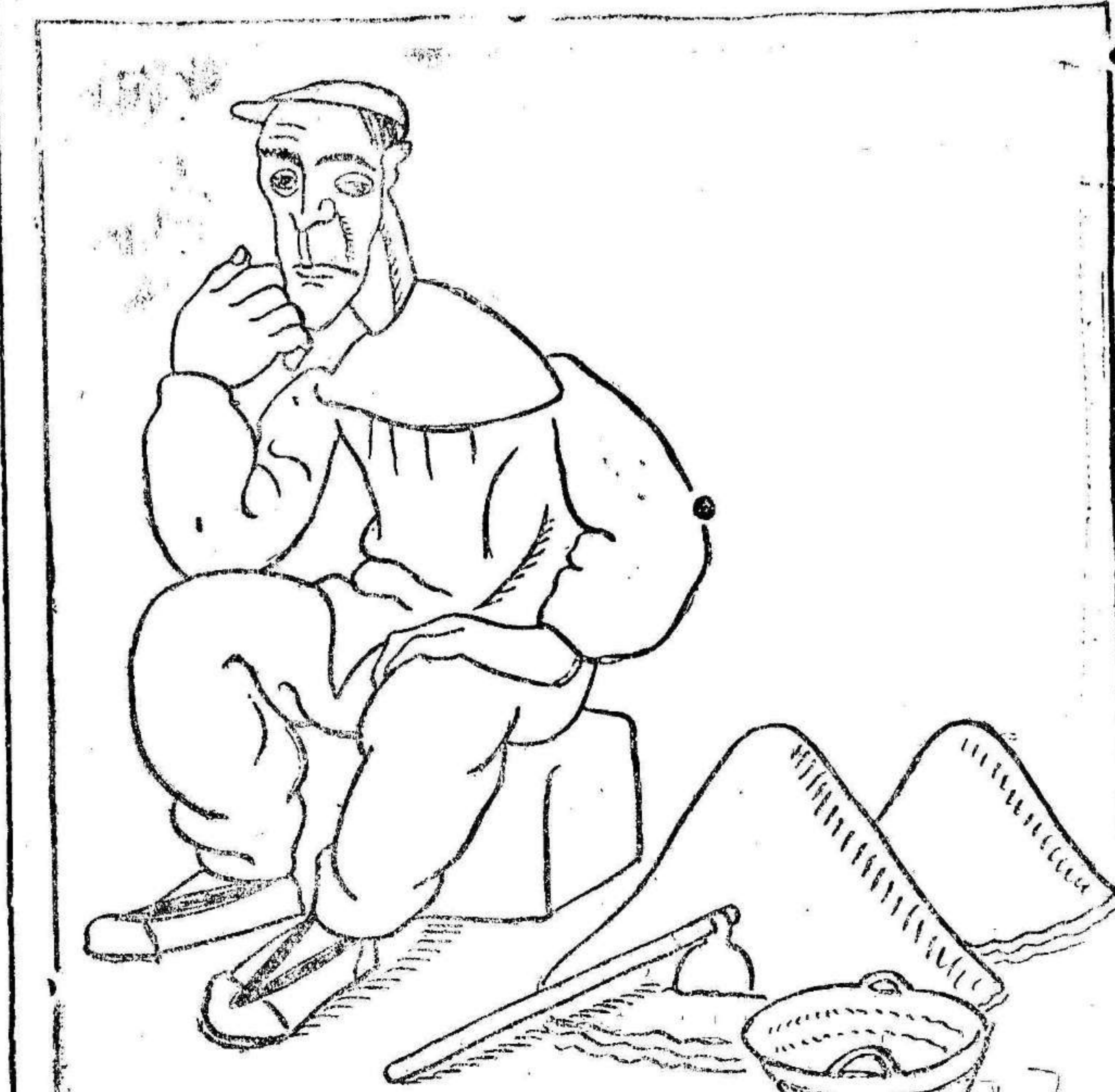
¡Qué dicha la de algunos mortales!... ¡Poder trabajar 50 años consecutivos sin tener que parar en el Asilo!