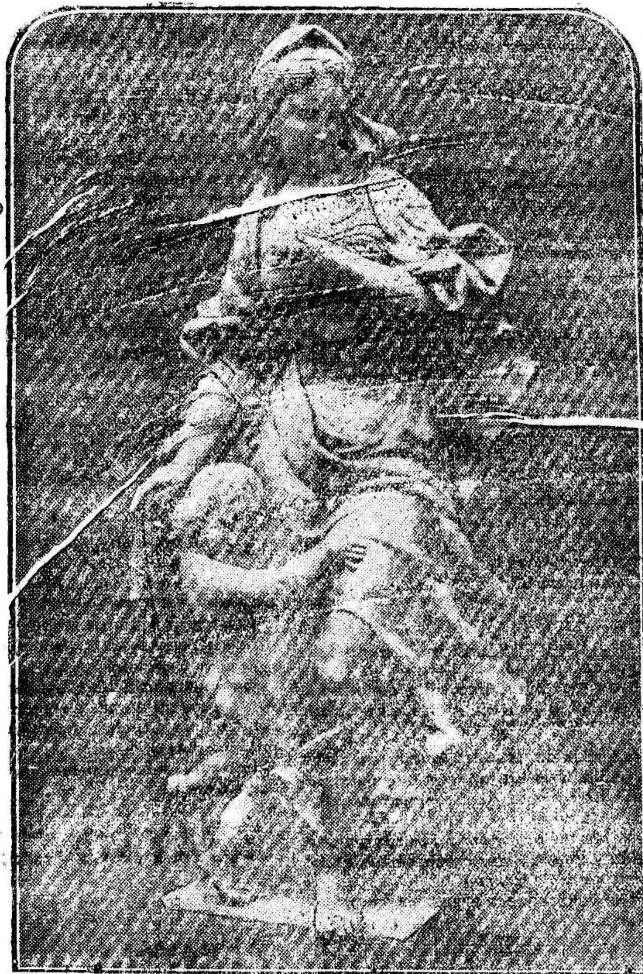
"MATERNIDAD", por José Viladomat

¡Qué gracia exquisita, qué recio vigor en esta modernización gentil de lo barroco! El talento singular de José Viladomat se revela en esta magnífica obra con poderío inconfundible. Y toda su vasta cultura artística, además. «Maternidad» es la obra excelente de un exculcador admirable.