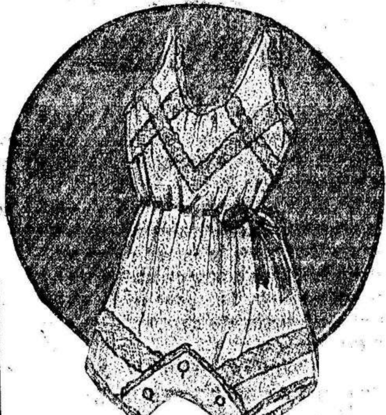
Camisa braga para señoritas

Con el fin de contribuir por mi parte a daros alguna distracción, he sido llamada, para hablaros del asunto que mas nos preocupa a todas, por regla general, es decir, de MODAS y de coqueterías, ya que no pueden existir las unas sin la otra, pues en