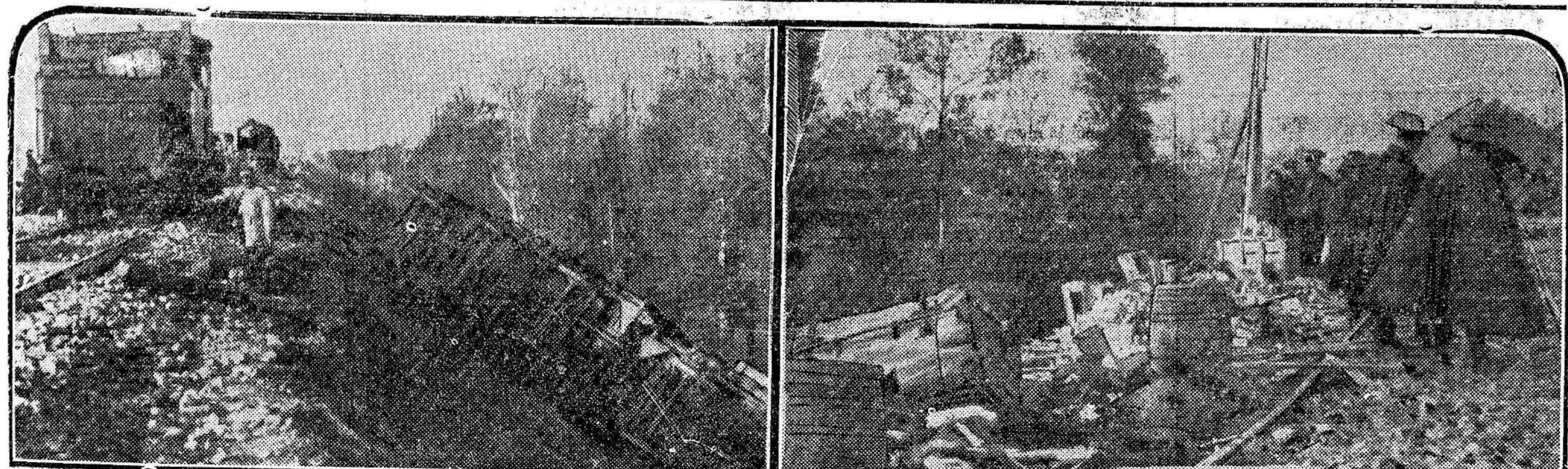
Del grave accidente ferroviario ocurrido el sábado en San Fernando de Jarama.—(De izquierda a derecha). Varios de los vagones del tren abordado que cayeron por un terrapién, y la guardia civil custodiando las mercancías, que con motivo del choque quedaron desparramadas por el suelo