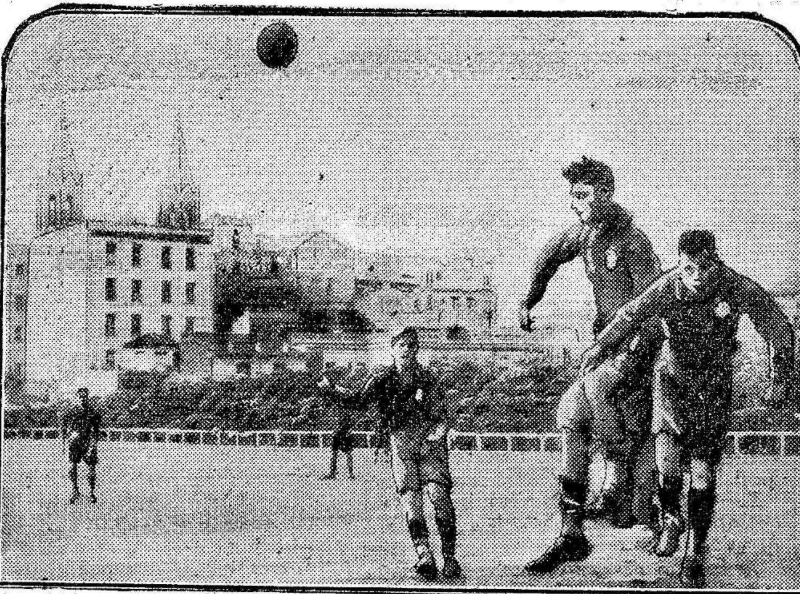
Del edificante partido Racing-Unión en Madrid.—Un momento de la correctísima patea, que terminó con la victoria del Racing.

Cotizaciones de hoy. Interior, 69'70 —Amortizable, 5 por 100, 00'00.—Amortizable, 4 por 100 00'00.—Banco de España, 58'50.—Tabacos, 413'00.—Francos, 28'90.—Libras, 33'92.—Dólares 0'00.—Liras, 0'00.—Francos suizos, 0'00