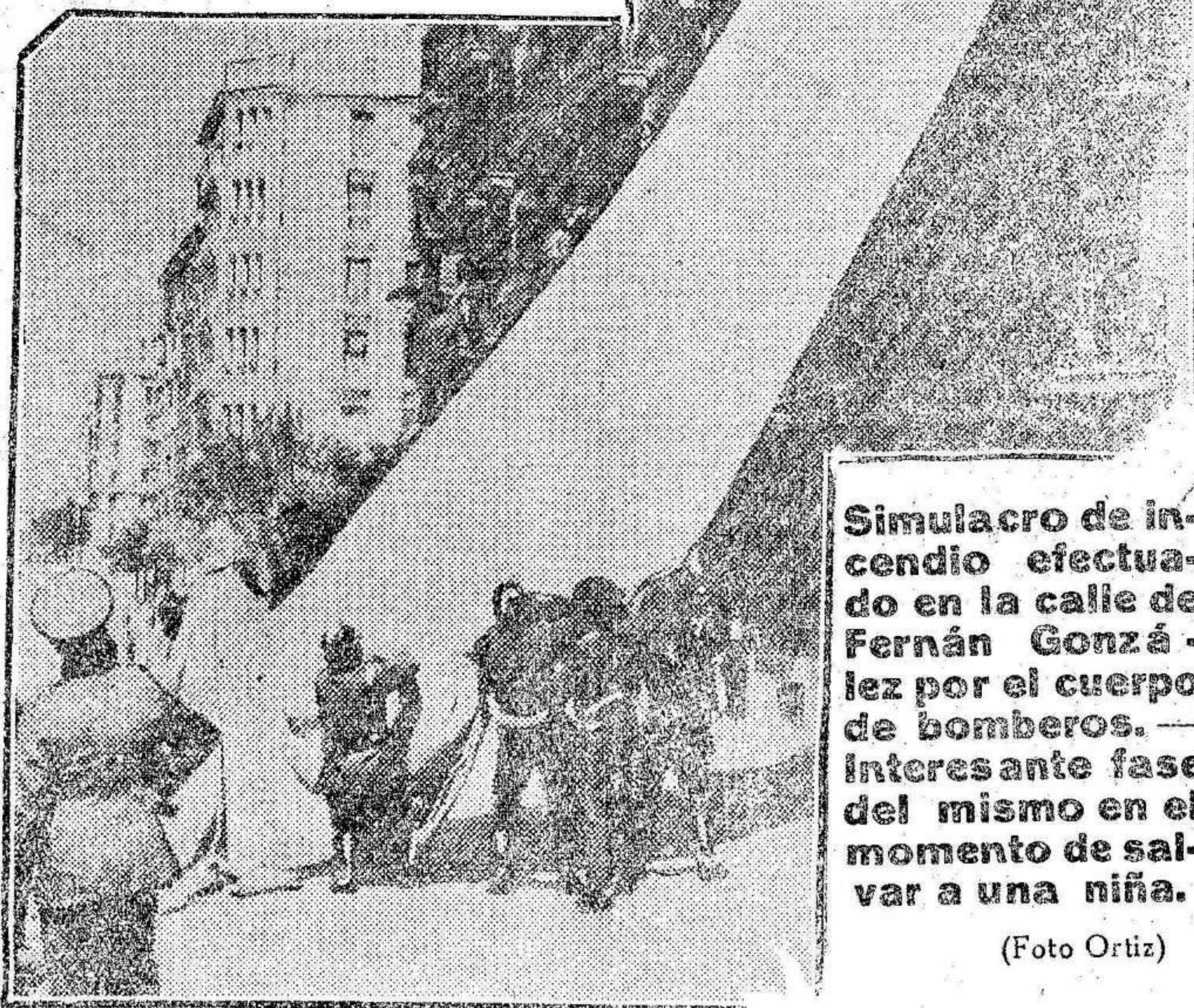
Simulacro de incendio efectuado en la calle de Fernán González por el cuerpo de bomberos. Interés ante fase del mismo en el momento de salvar a una niña.

El admirable servicio de extinción de incendios de la villa del oso y del madroño... y de Larra