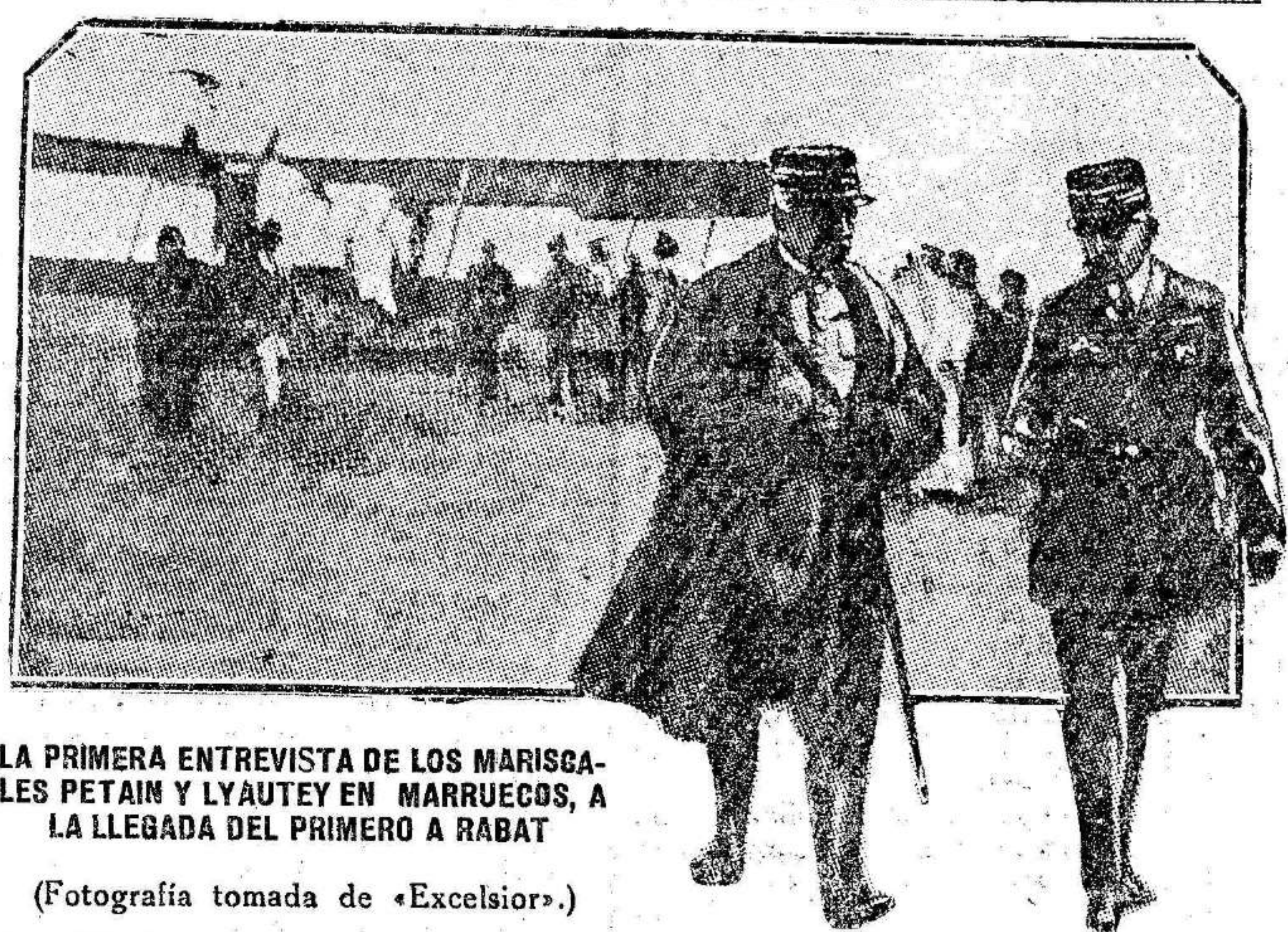
LA PRIMERA ENTREVISTA DE LOS MARISCALES PETAIN Y LYAUTEY EN MARRUECOS, A LA LLEGADA DEL PRIMERO A RABAT