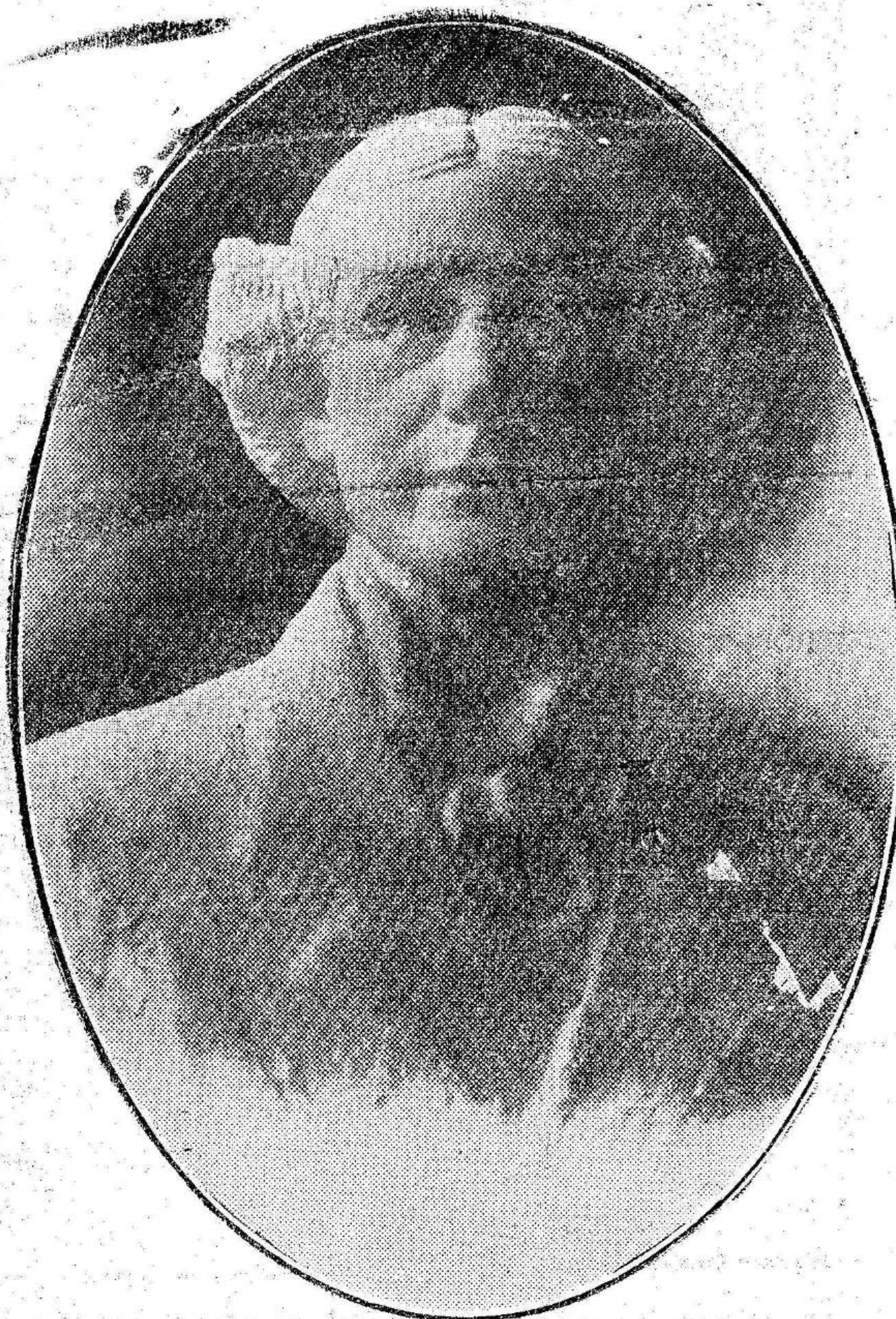
JOSE MARTINEZ MONROY (Escultura de J. Moya) ILUSTRE E INMORTAL POETA CARTAGENERO

de la cultura patria: cartagenero fué San Isidoro, faro luminoso de la Edad Media, filósofo de todas las edades y una de las más firmes columnas de la fe católica; cartagenero fué el loro Maíz, genio creador dentro del arte escénico, cuya fama traspasó todas las fronteras; cartagenero fué Peral, el inmortal inventor del submarino, a quien debe la náutica un paso gigante; cartagenero fué Villamartin, el brillante escritor, el estratega insigne, cuya táctica guerrera hubo de adoptarse en diversos Estados; cartagenero fué Monroy, uno de los más insignes poetas del siglo XIX; cartagenero fué Rosique corazón magnánimo, que al par que Roldán, cimentó ese templo