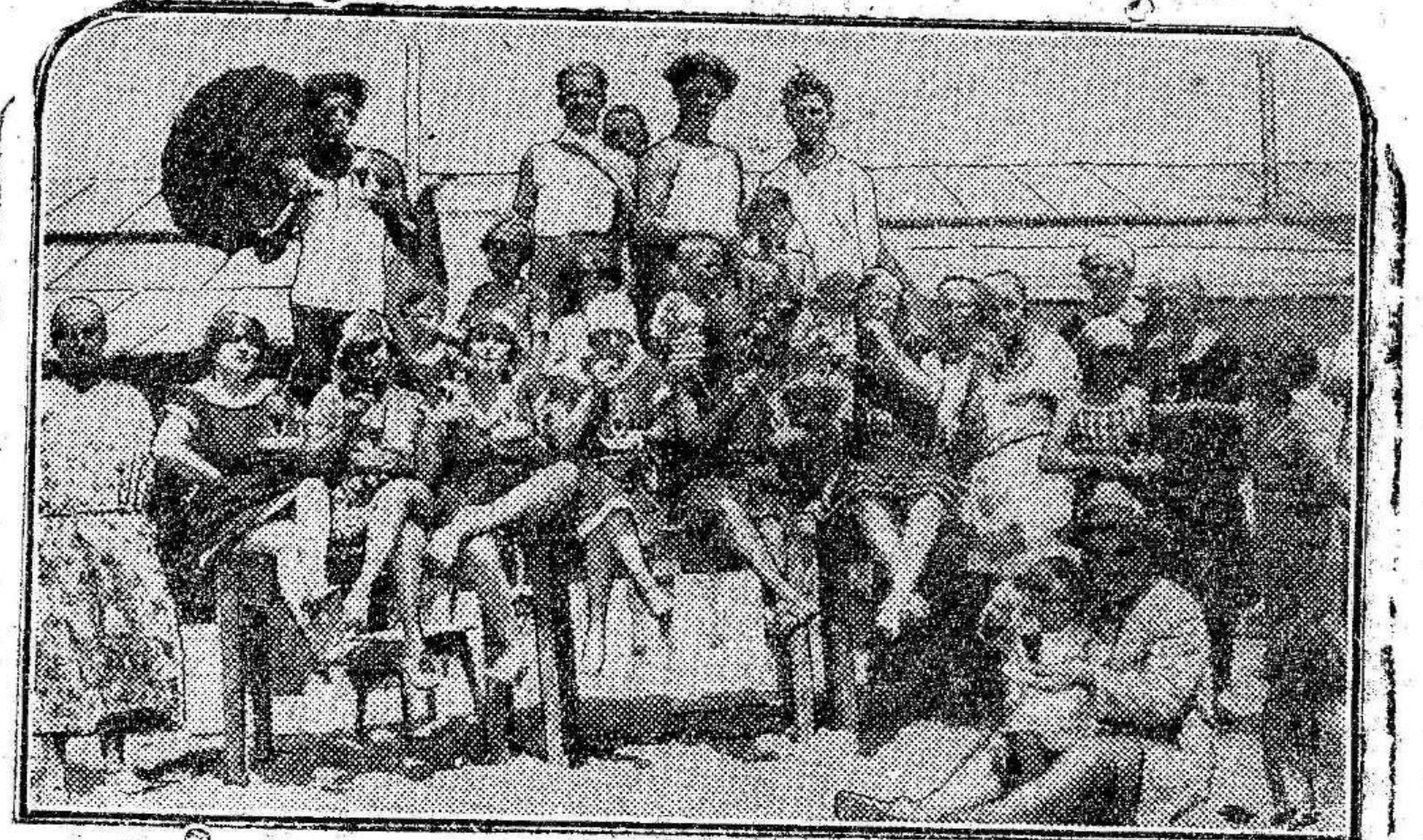
Recientemente se ha inaugurado la nueva línea ferroviaria que une a Roma con el puerto de Ostia. Quiere esto decir que Roma tendrá su Lido, su playa elegante y mundana «a dos pasos» de la ciudad. De fluvial, Roma se hará marítima, al menos durante los veranos. Ya en éste, que va de capa caída—capa de baño, naturalmente—las alegres romanas han abandonado la severa visión de las piedras venerables, para bollar con ligera planta la arena de la playa de Ostia. El grabado nos muestra un grupo de bañistas romanos que se solazan en «su playa», frente a la maravilla del mar cantado por D'Annunzio.

La guardia civil ha detenido a un sujeto por suponerse autor del siniestro.