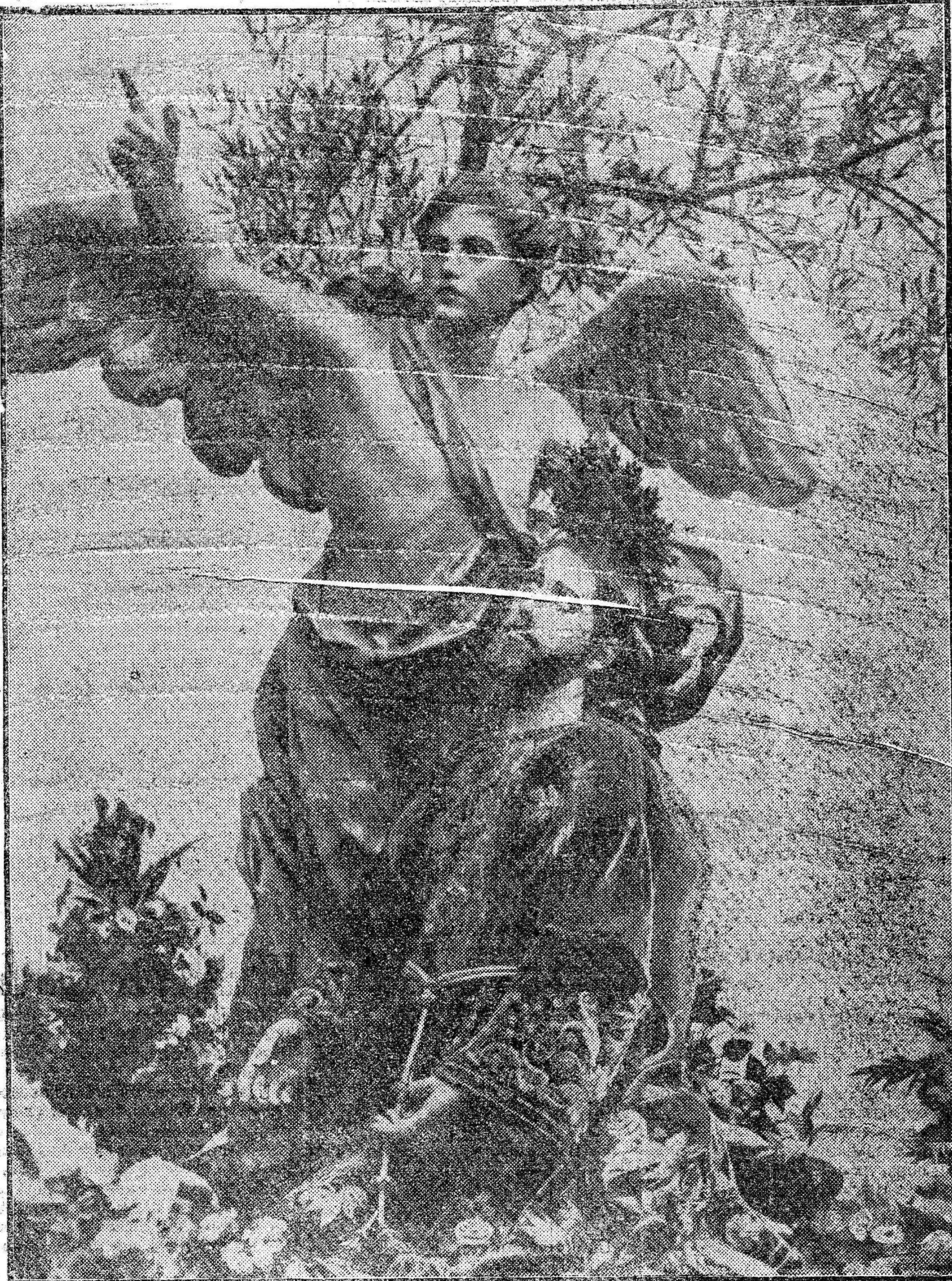
El Angel de la Oración. (Salzillo)

Por telégrafo Tres detenidos Madrid 23.—A las 9 n. En el pueblo de Pedro Martínez, la guardia civil ha detenido al presi- dente, tesorero y un vocal de la so- ciedad Sindicato Católico. Se ignoran los motivos por que han sido detenidos. El vecindario celebró una mani- festación para reclamar la libertad de los detenidos. El alcalde intentó calmar los ánimos de la muchedumbre siendo silba- do por esta. La guardia civil ha sido reconcen- trada.