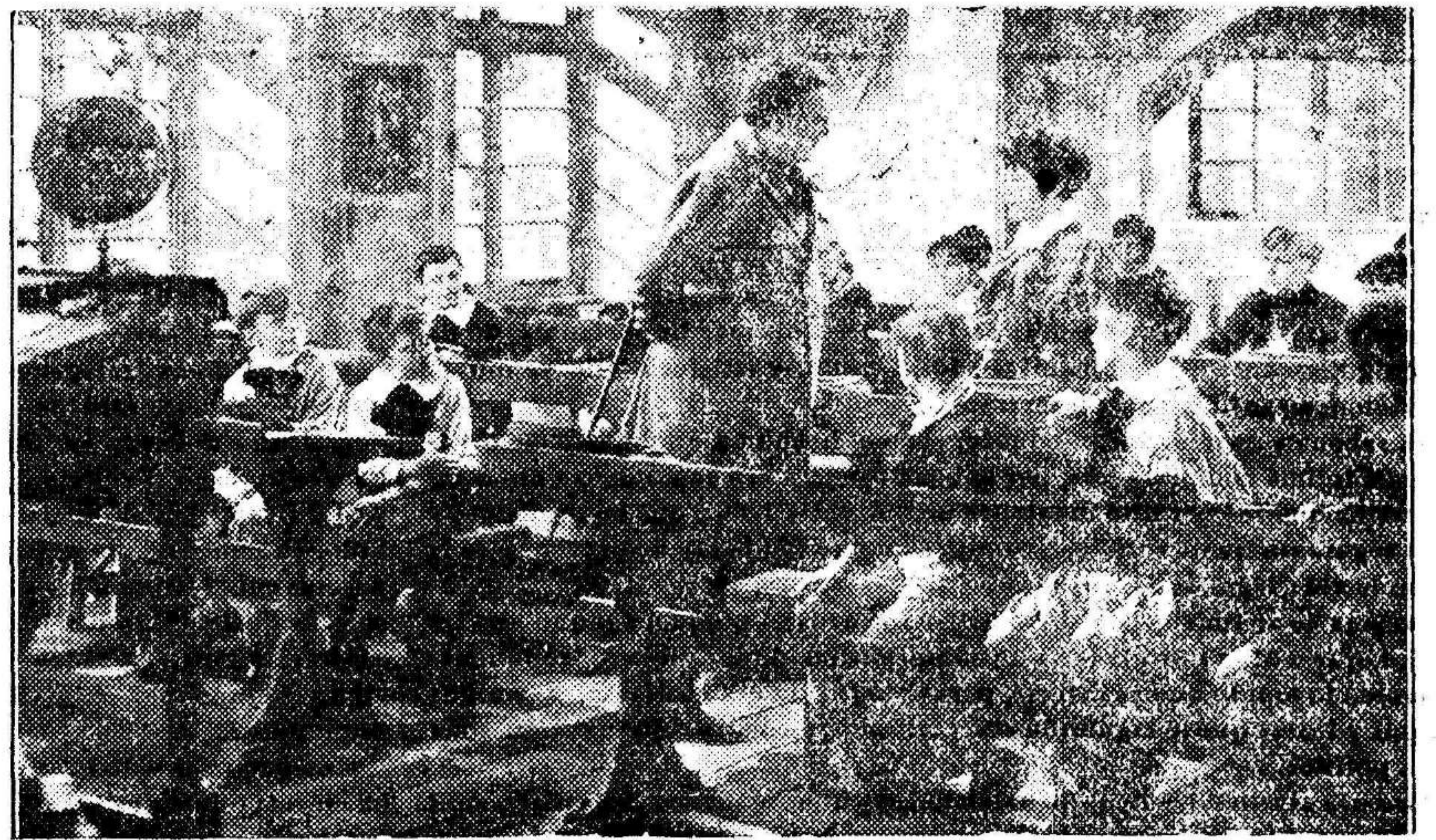
Una de las bellísimas escenas de la producción B. I. P. «AL LLEGAR LA PRIMAVERA», de CIFESA

—Yo creo, —dice la bellísima estrella de la Columbia— que mi tipo no agrada a los animales.