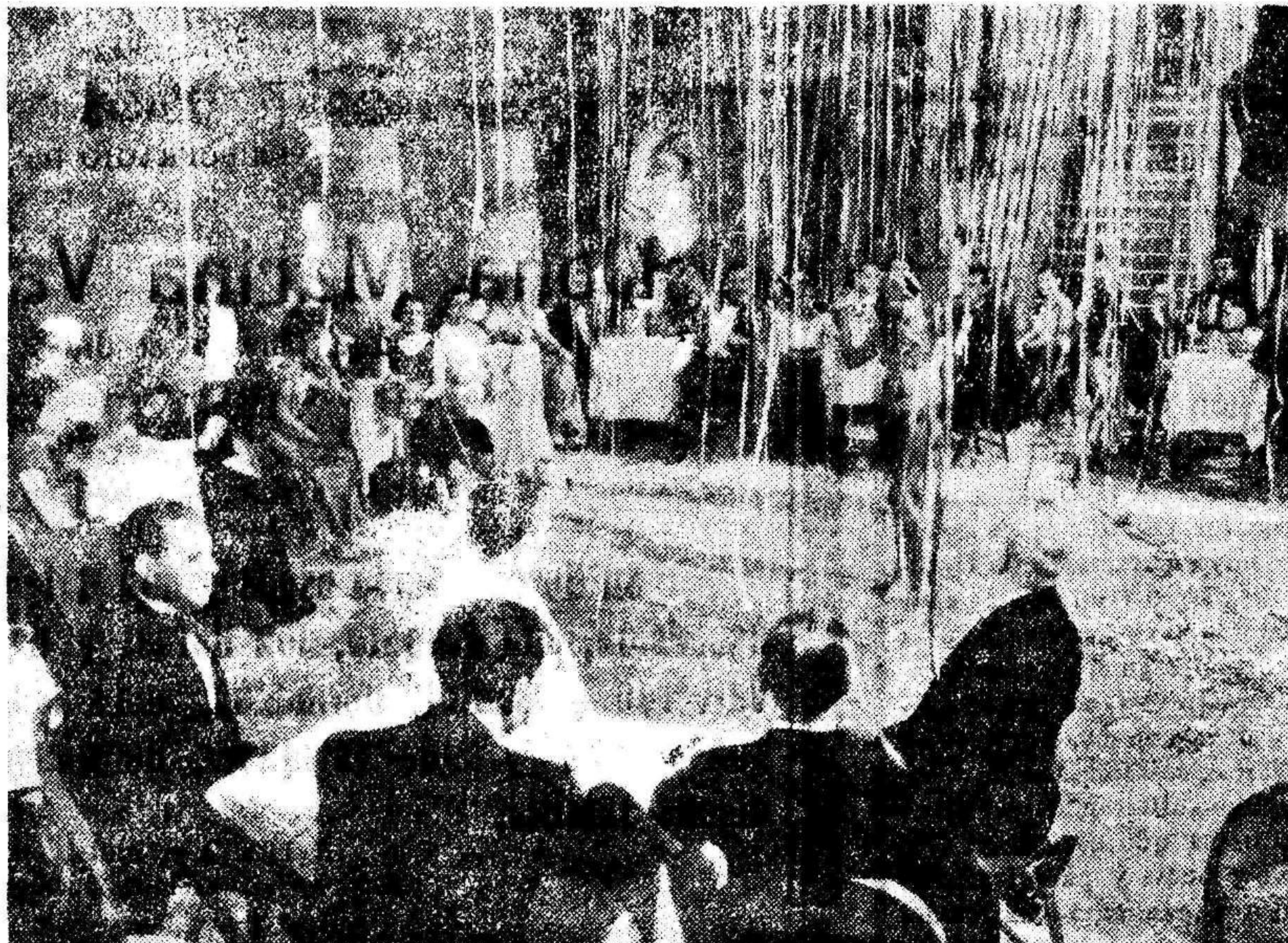
«RATAPLAN», super-producción nacional protagonizada por Antonita Colomé y Félix de Pomés, que presentará CIFESA en la temporada que se avecina.

El feliz matrimonio que al año y medio de tener el primer hijo, un niño blanco y rubio como sus padres, tuvieron luego gemelos y ahora son los orgullosos padres de tres muchachos que parecen querubines? —Dixie Lee y Bing Crosby.