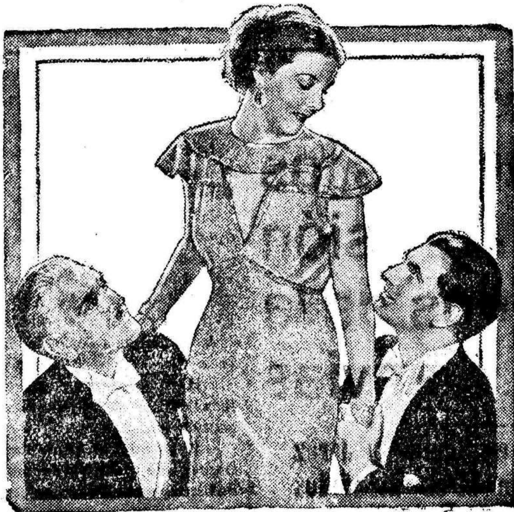
Frank Morgan, Eliza Landi y Joseph Schildkraut en «LA MUJER DE MI MARIDO», interesantísima producción americana que distribuye la entidad valenciana Cifesa.