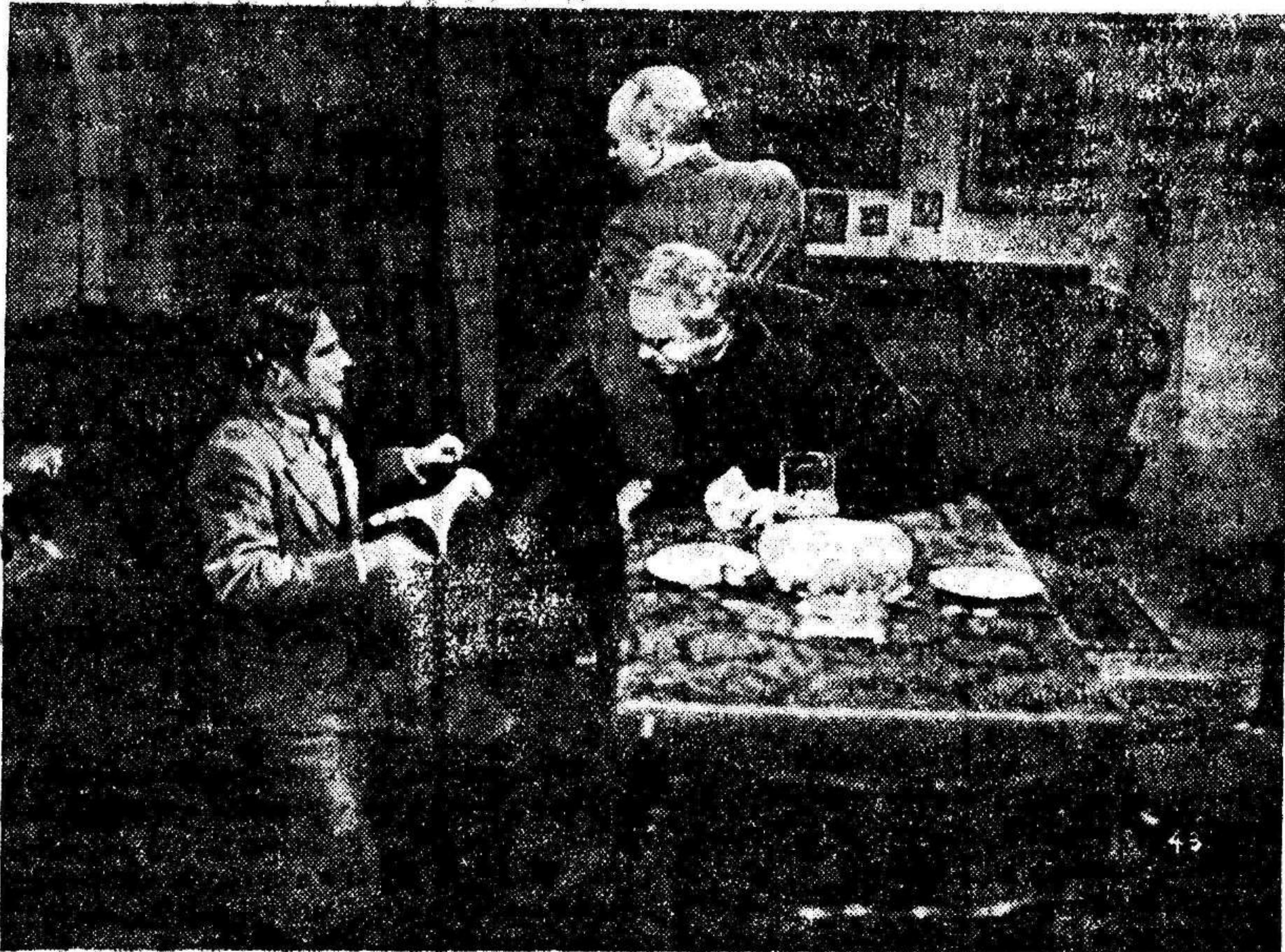
Una emocionante escena de la producción alemana «LA SANTA Y EL LOCO», que distribuye la potente entidad valenciana CIFESA.

Uno de los directores artísticos más conocidos de la Ufa, Carlos Hartl en su última película «El Barón Gitano» pudo emprender su marcha triunfal por el mundo entero, trabaja actualmente en los preparativos para el primer film monumental de ópera de la Ufa que será rodada con arreglo a la ópera de Mozart titulada «Las Bodas de Figaro».