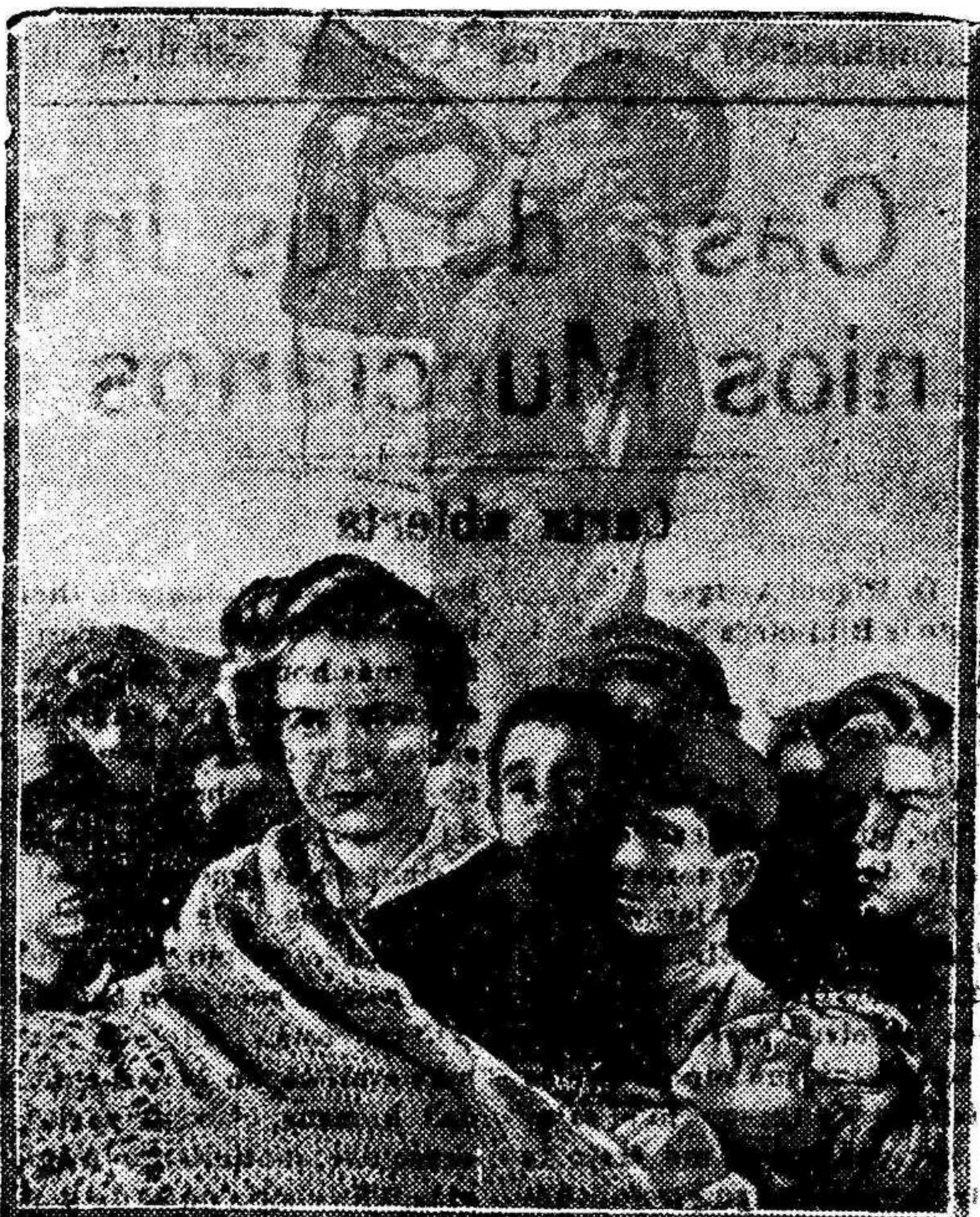
Una escena de la película «UNA NOCHE DE AMOR», que distribuye Cifesa.