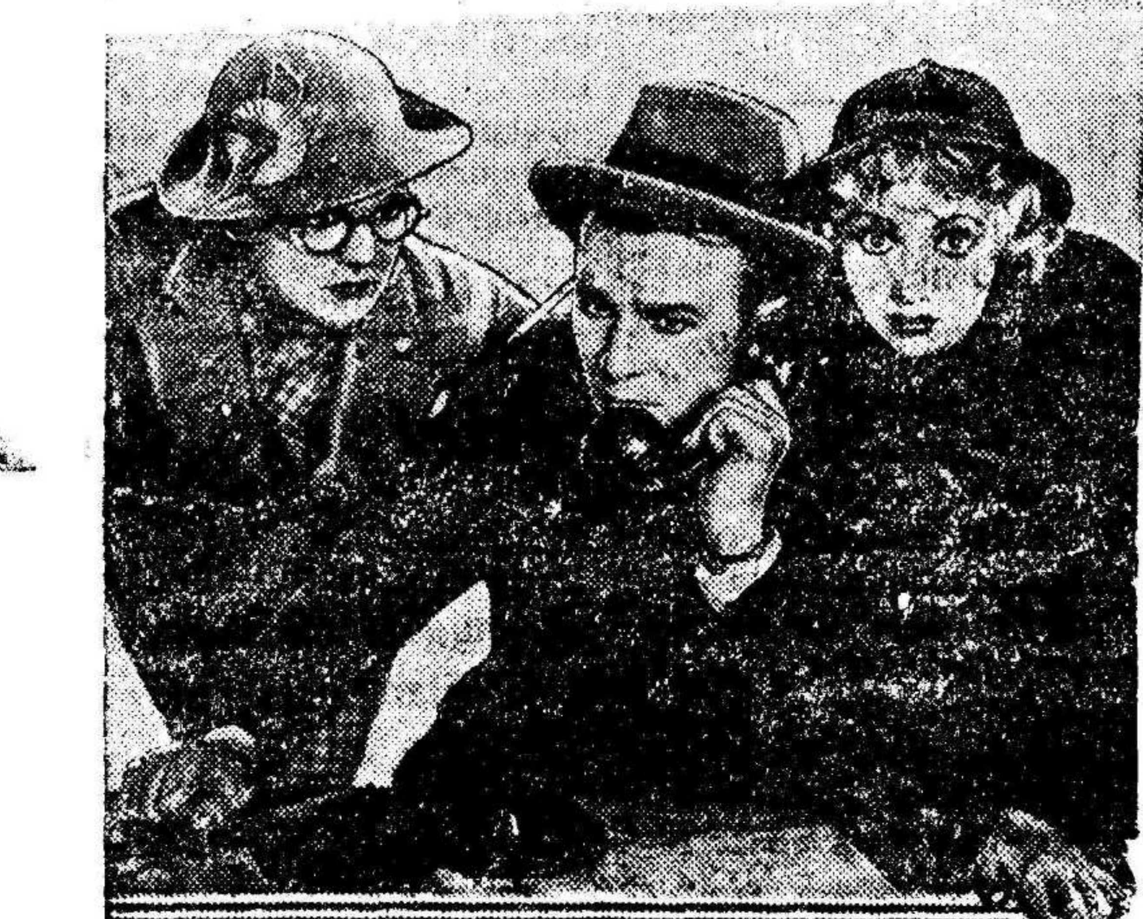
Una escena del divertido film de Cifesa LA GATA INFERNAL