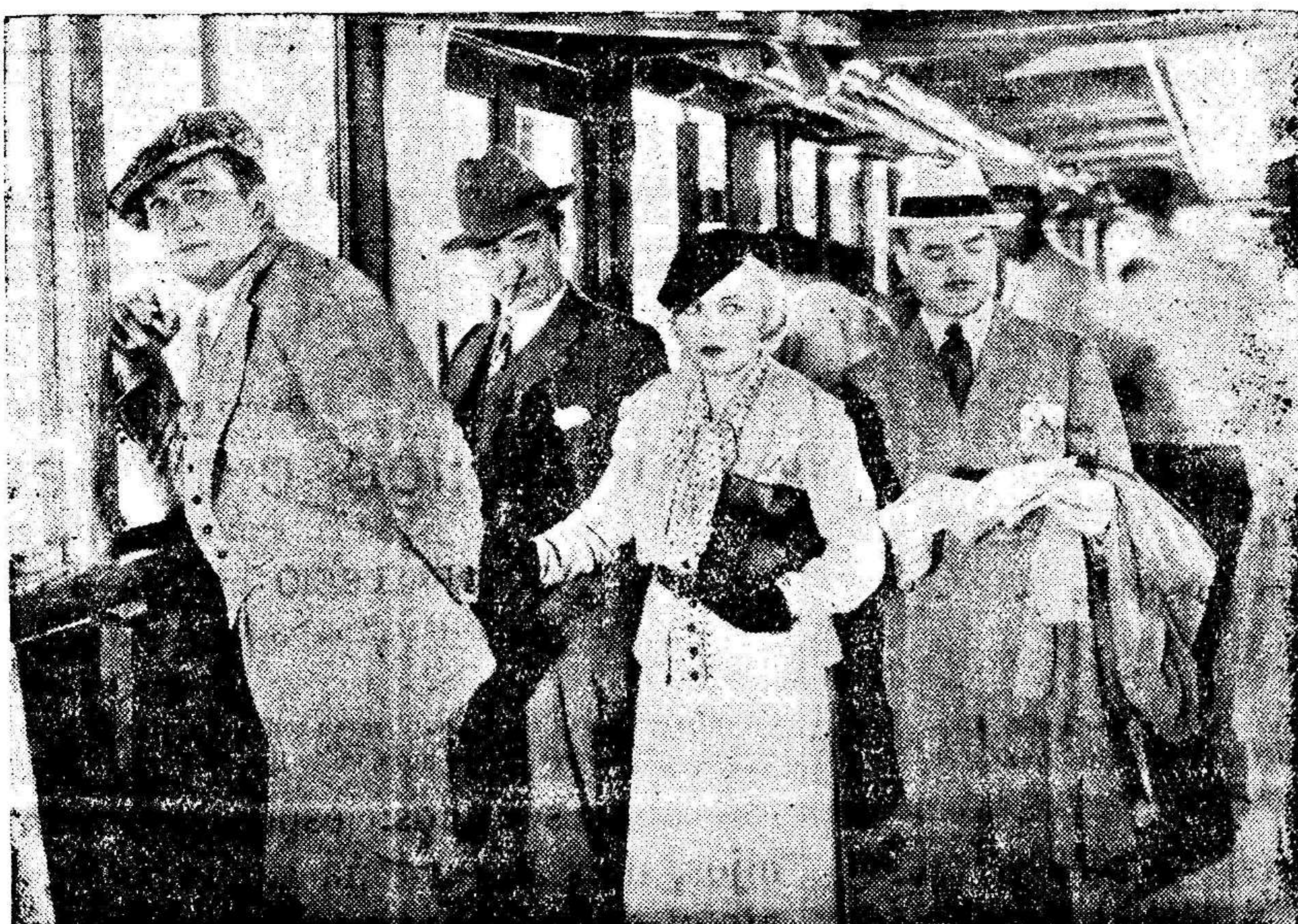
Una escena de EL CAPITAN ODIS EL MAR, interesantísima producción Columbia que distribuye la prestigiosa entidad valenciana CIFESA

La creación que ambos actores hacen en este film distribuido por Cifesa, es indudablemente un aliante más, con el que consigue un triunfo la conocida marca inglesa B. I. P.