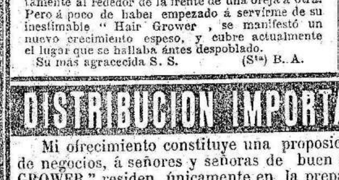
Me ha vuelto a salir y a crecer el pelo en la parte superior de la cabeza.

UN NUEVO CRECIMIENTO DEL CABELLO EN DONDE EXISTIA UNA CALVICIE COMPLETA.