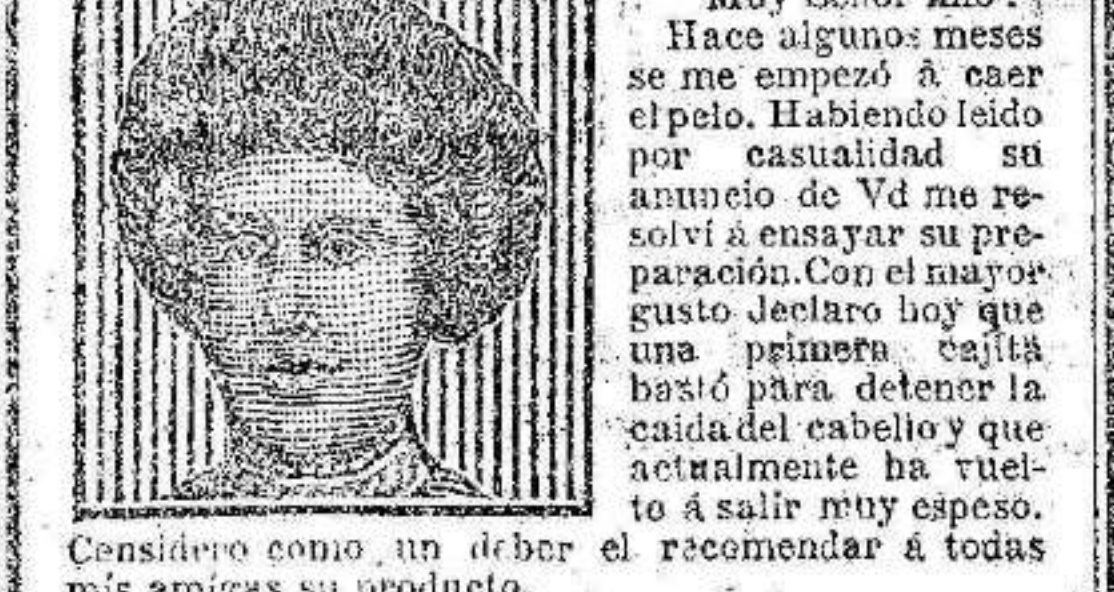
Considero que un deber el recomendar a todas mis amigas su producto.

CAIDA DETENIDA, CABELLERA MUY ESPESA AHORA.