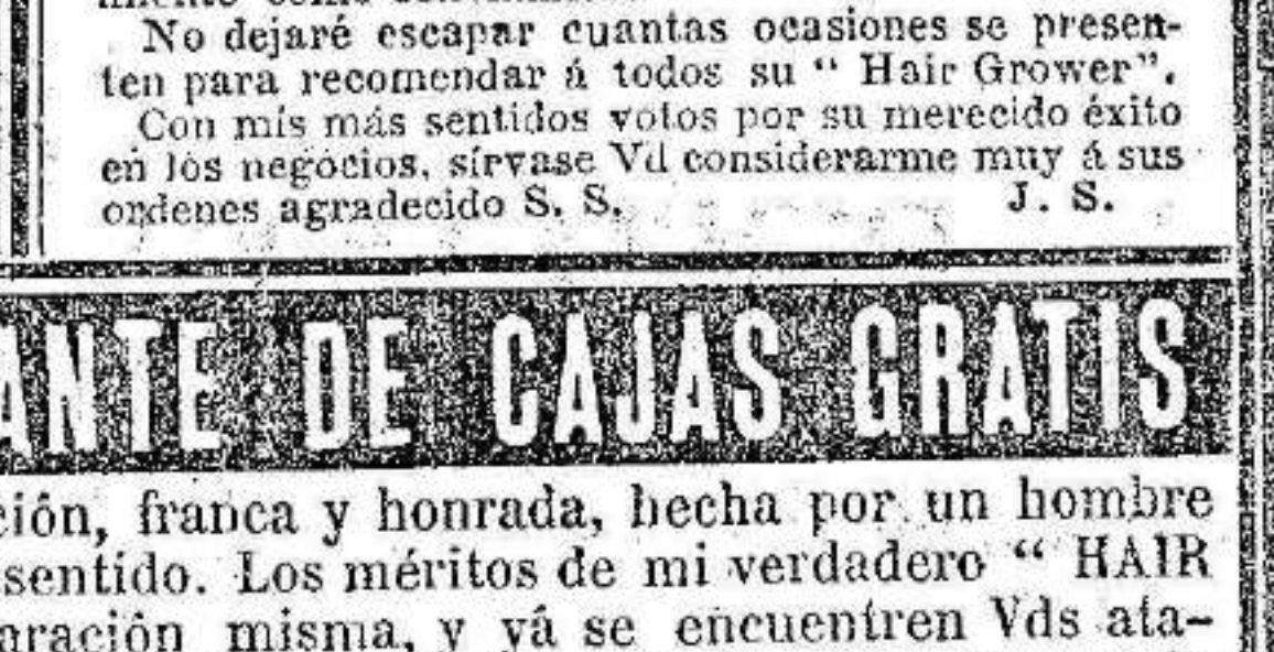
Antes S. S. B. G. S.