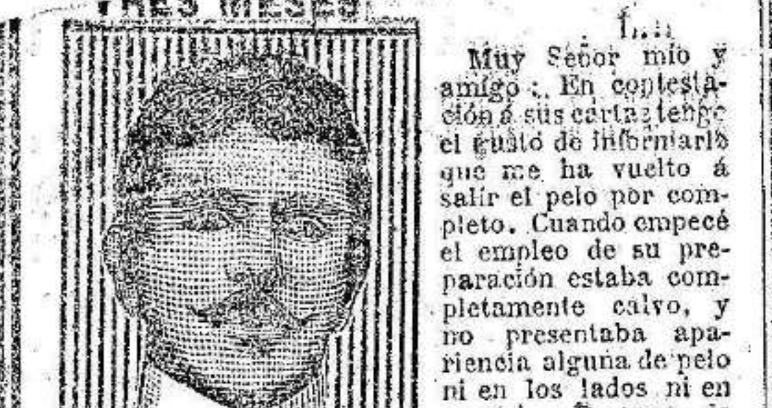
Me ha vuelto a salir y a crecer el pelo en la parte superior de la cabeza.

ESTABA ENTERAMENTE CALVO. LE HA VUELTO A SALIR EL CABELLO ENTERRAMENTE EN TRES MESES.