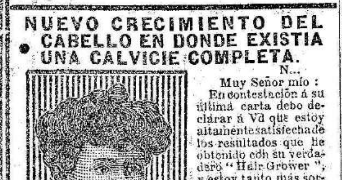
Me ha vuelto a salir y a crecer el pelo en la parte superior de la cabeza.

LA PRIMERA CAJA HACE CRECER EL CABELLO ESPESO.