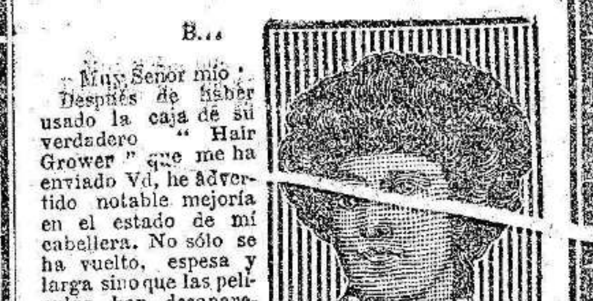
Antes S. S. B. G. S.

LA PRIMERA CAJA HACE CRECER EL CABELLO ESPESO.