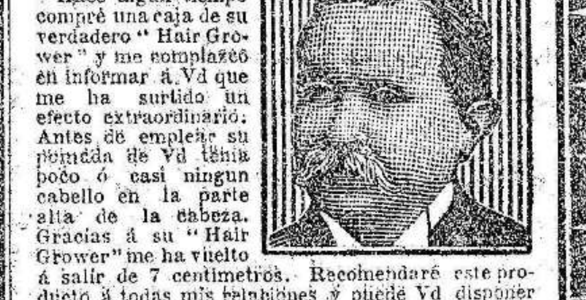
Antes S. S. B. G. S.

ESTABA ENTERAMENTE CALVO. LE HA VUELTO A SALIR EL CABELLO ENTERRAMENTE EN TRES MESES.