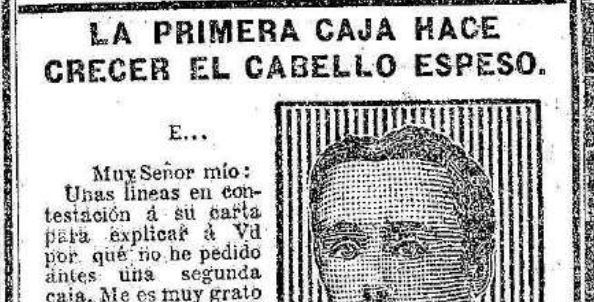
Antes S. S. B. G. S.

UN NUEVO CRECIMIENTO DEL CABELLO EN DONDE EXISTIA UNA CALVICIE COMPLETA.