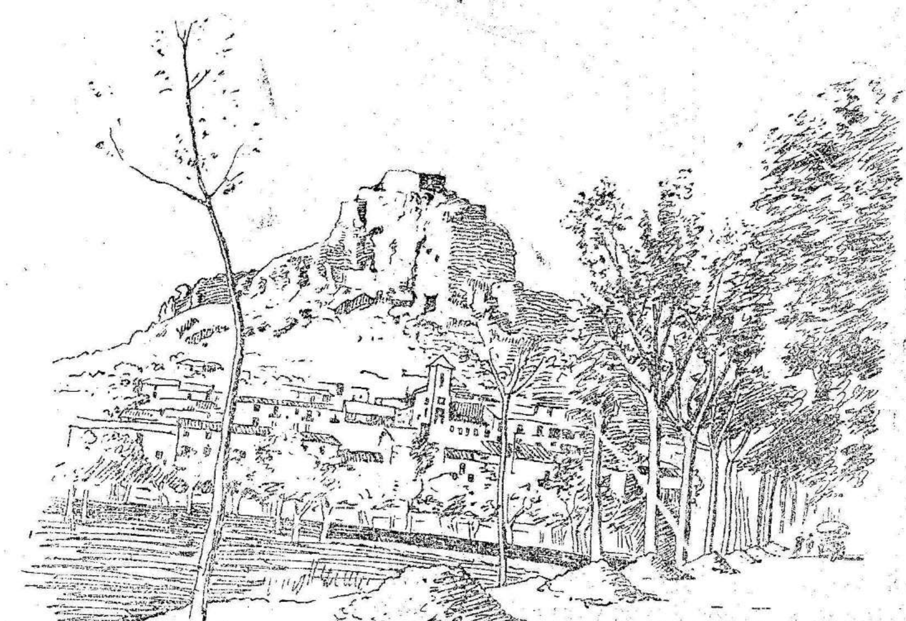
MURCIA ANTIGUA.—VISTA DEL CASTILLO DE MONTEAGUDO