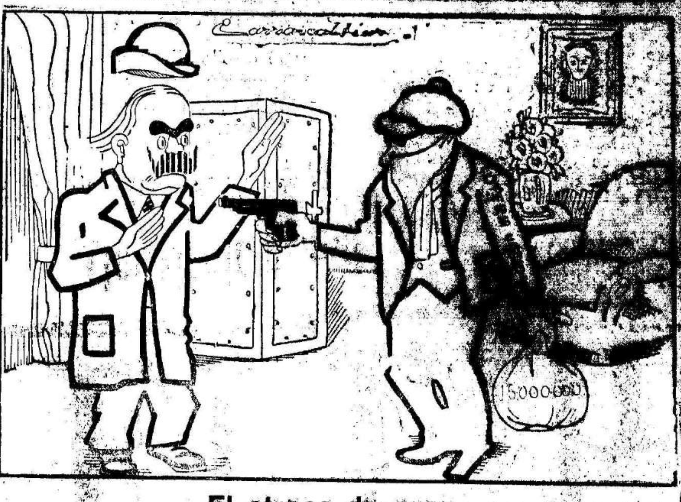
El atraco de ayer.

Diálogo: —En la Casa de Socorro ha tocado la lotería. —Y en la Diputación también (véase la sesión de ayer).