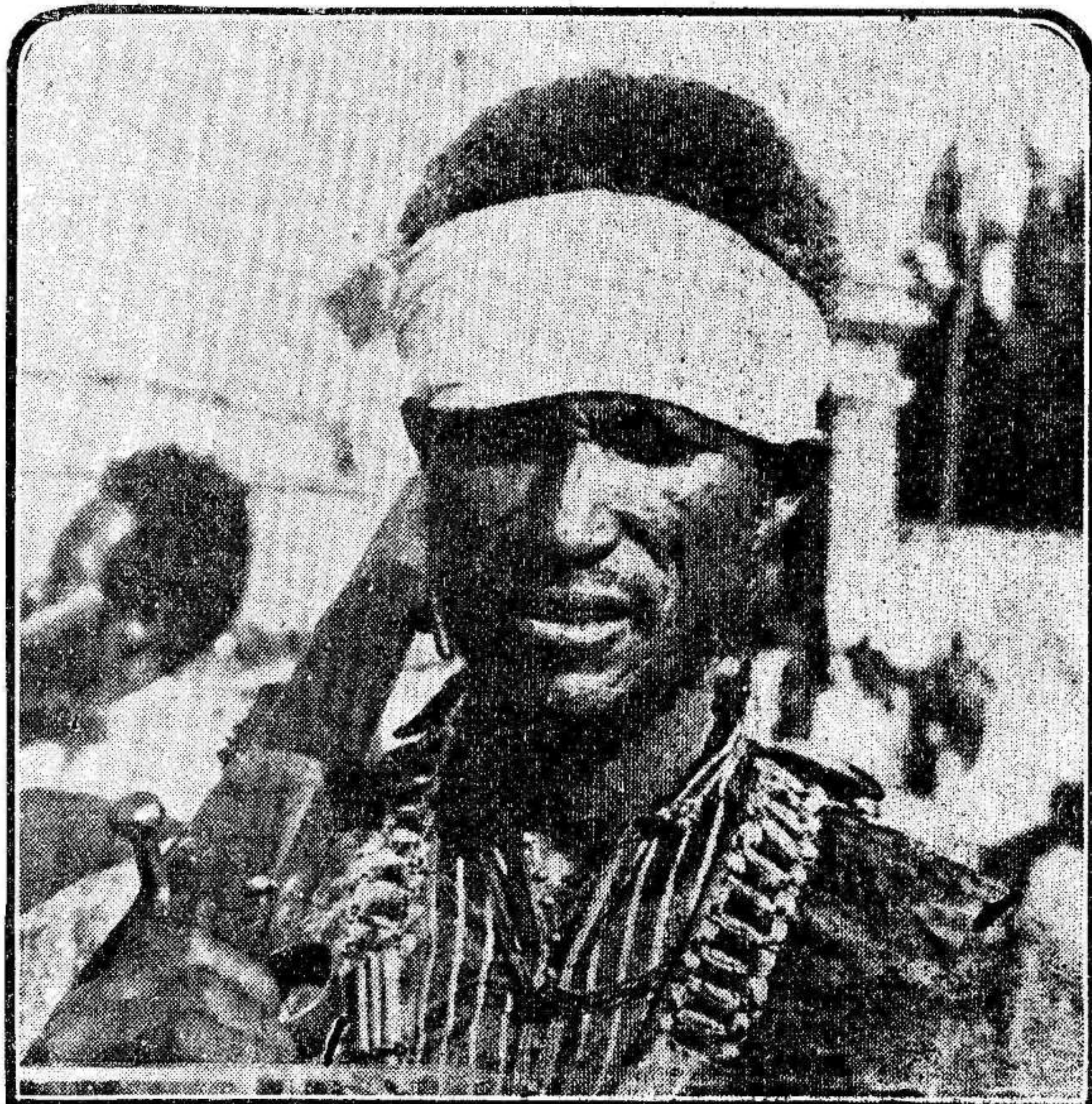
Uno de los miles de guerreros abisinios que, armados de fusiles modernos, desfilaron recientemente ante el palacio de Addis Abeba.

Las fuerzas del "ras" Seyun inician la ofensiva etíope en el frente norte