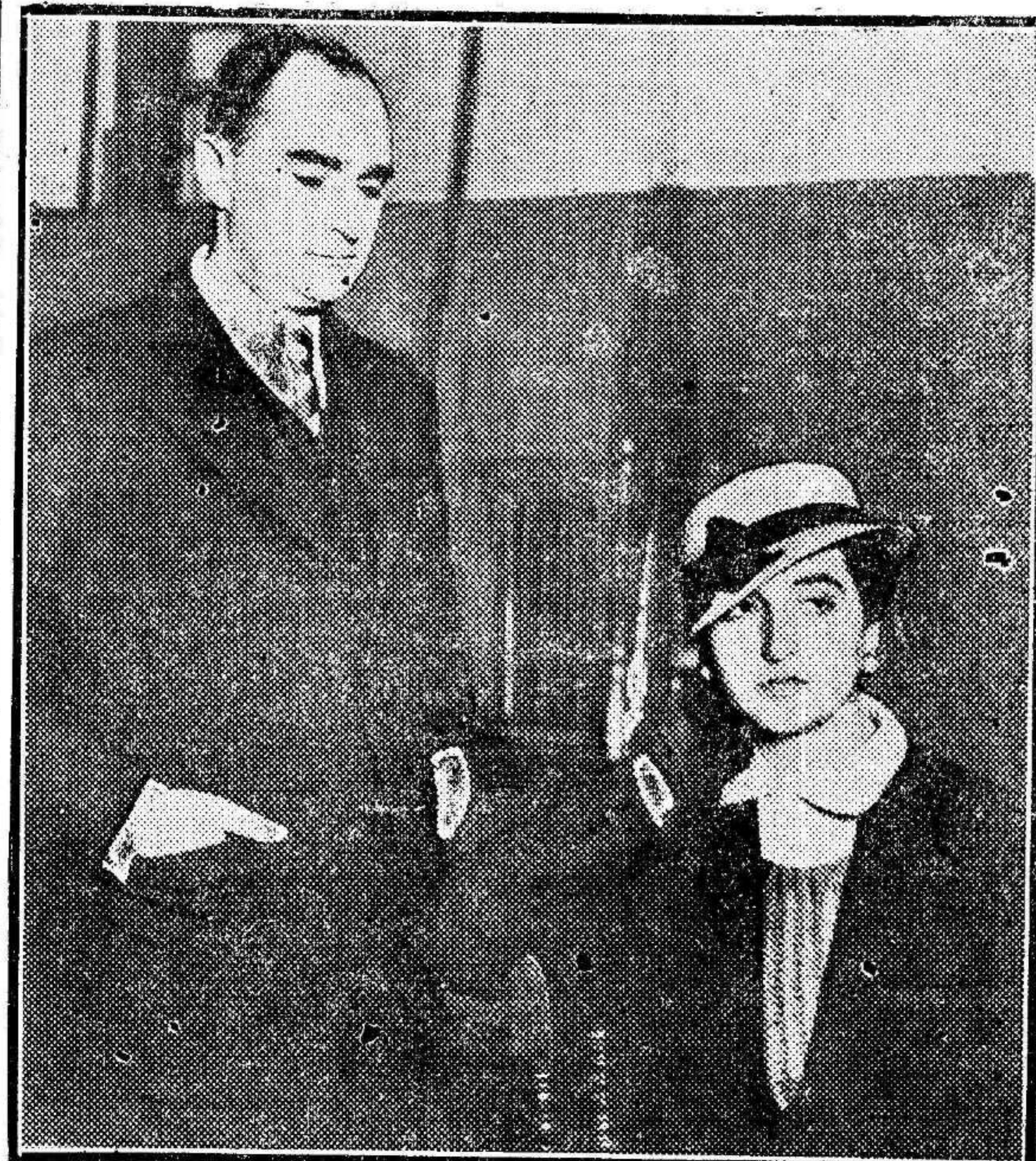
María Guerrero y Fernando Díaz de Mendoza, ilustres artistas que actúan en Roma y cuya labor hace rememorar a la genial pareja de iguales nombres, que fueron indiscutibles señores de la escena española

Terminada la ceremonia de la imposición del capelo cardenalicio a Monseñor Tedeschini, por el Presidente de la República, el del Consejo, señor Portela Valladares fué abordado por los periodistas con los que sostuvo la siguiente conversación: