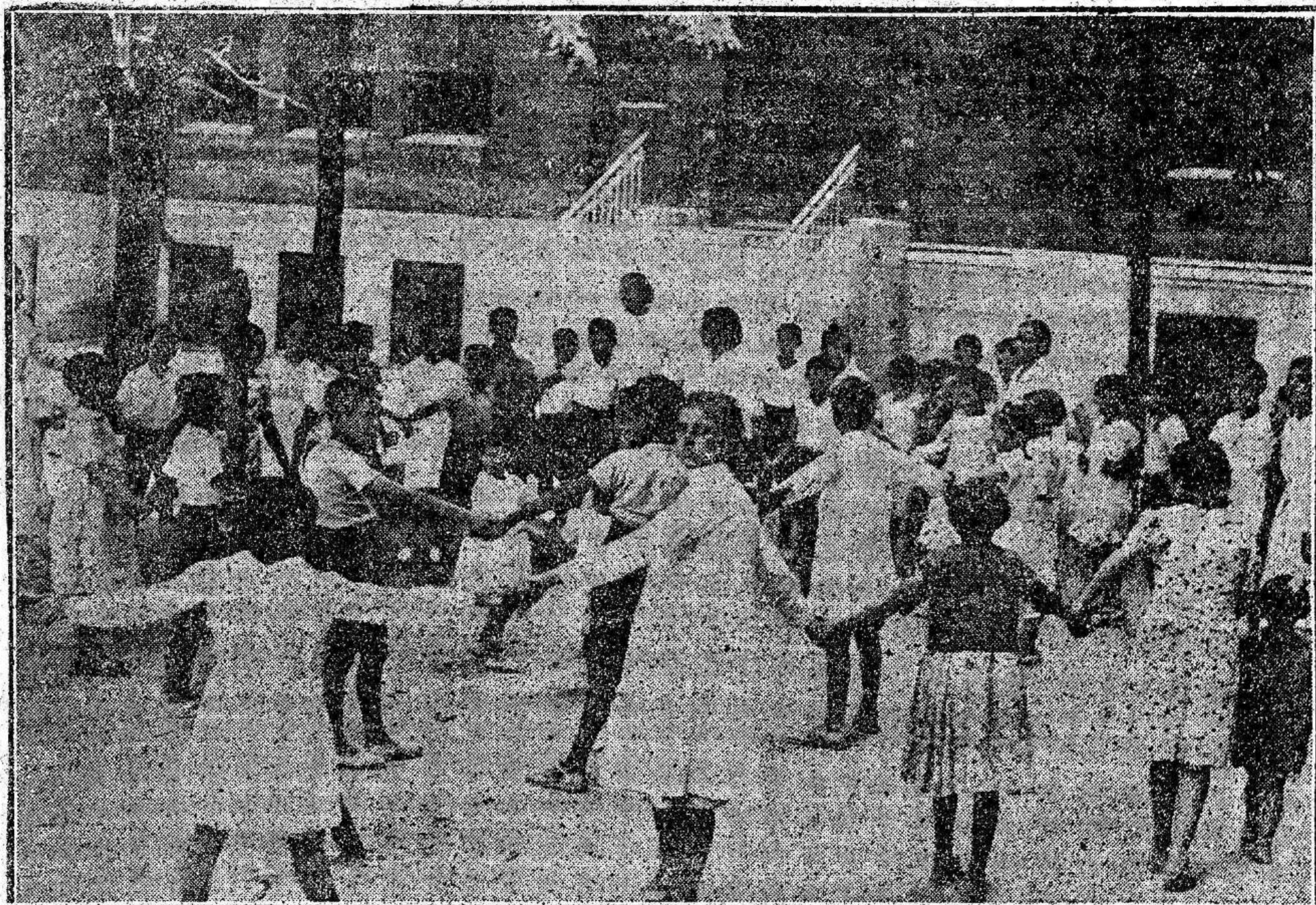
EN UNA DE LAS GUARDERIAS INFANTILES DE GUERRA.—Niñas y niños confraternizan en sus juegos