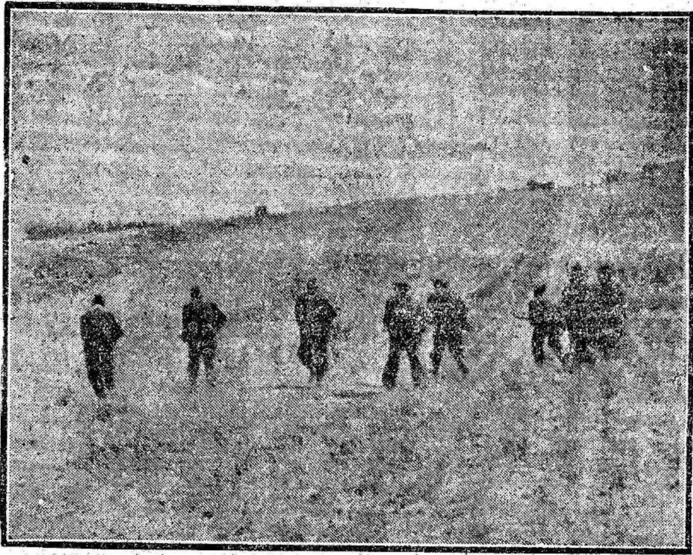
Milicianos desplegados en guerrilla en uno de los frentes leales.