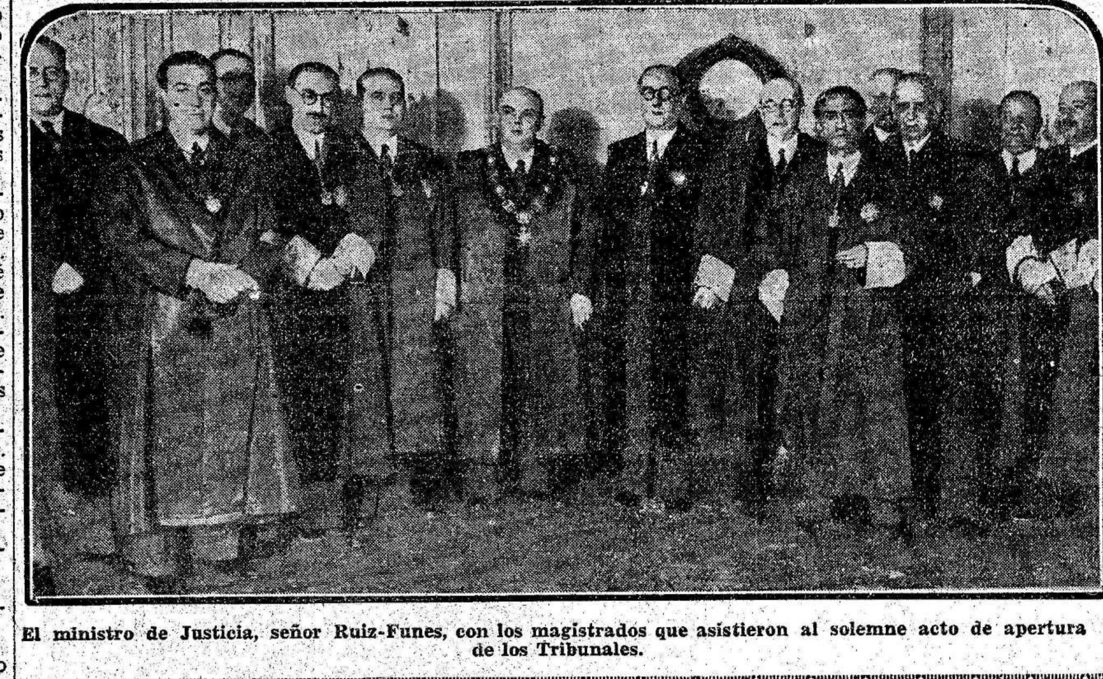
El ministro de Justicia, señor Ruiz-Funes, con los magistrados que asistieron al solemne acto de apertura de los Tribunales.

terero. No sabe que Moisés Gallego haya intervenido en el movimiento y que no se opuso a que él se apuntase a la U. G. T.