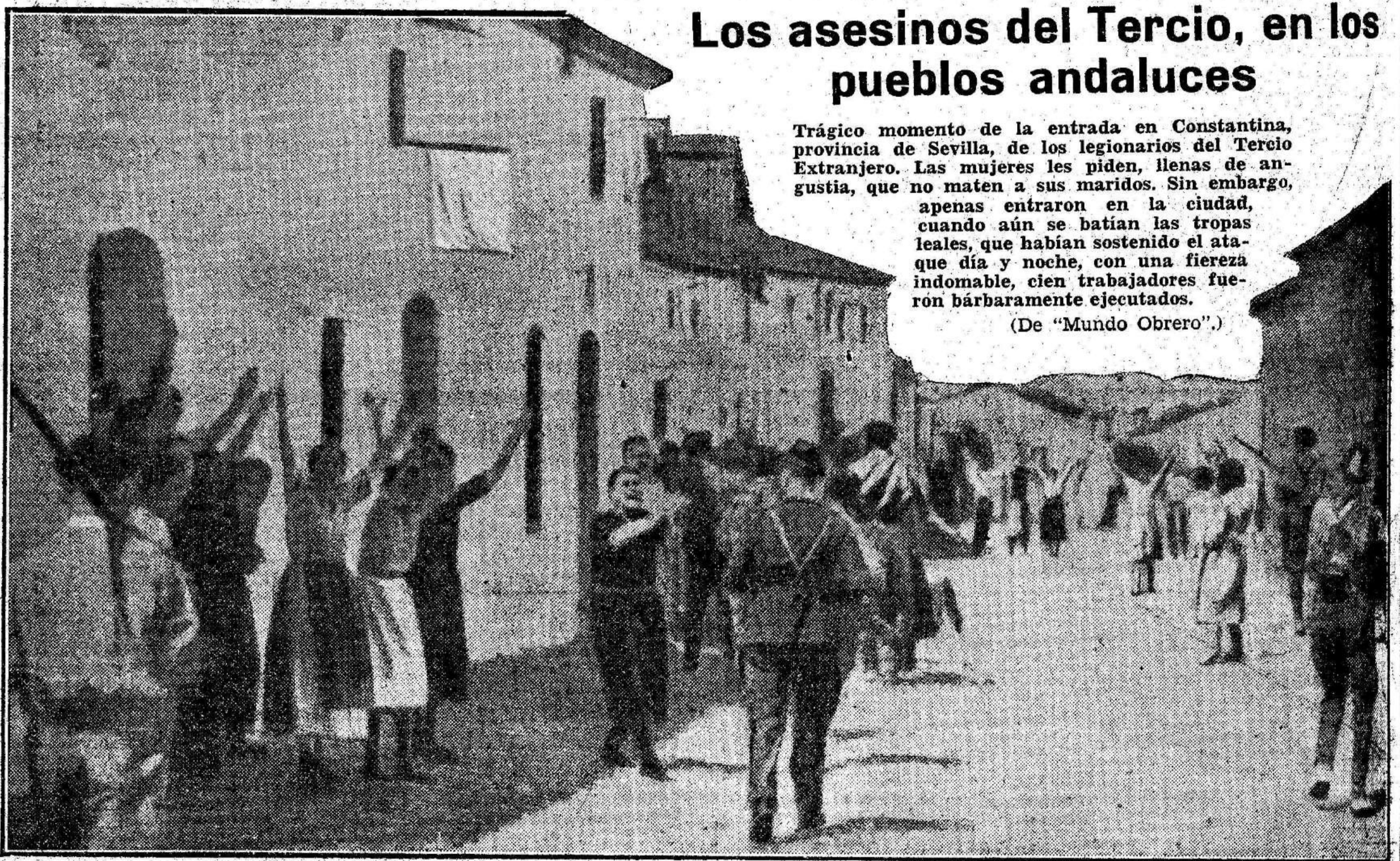
Los asesinos del Tercio, en los pueblos andaluces

En todos los pueblos cordobeses se ha izado ya la bandera tricolor.--La jornada de ayer destacó la bravura y el heroísmo del capitán Siminiani y sus artilleros del Sexto Ligero, y del intrépido capitán Calderón, el héroe de la toma de Albacete.--Nuestro corresponsal de guerra se une a los que parlamentaron con los rebeldes la rendición del pueblo de Dos Torres.