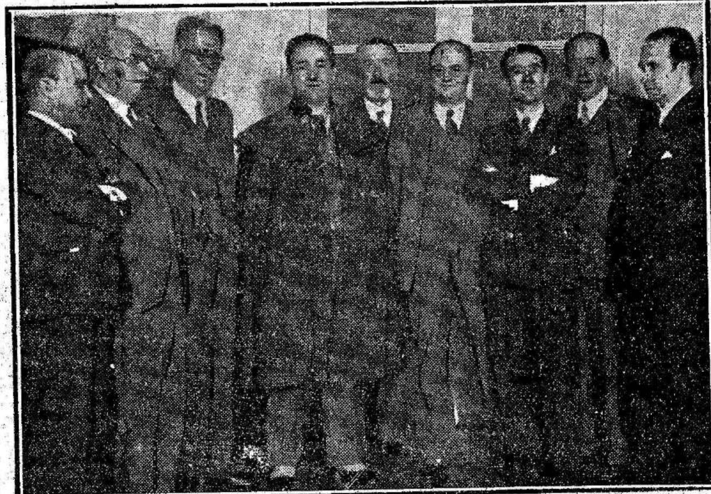
El notable tenor italiano Lauri Volpi, en el acto de serle entregada una castiza capa con que le obsequia la Asociación de la Prensa murciana como correspondencia a su desinteresada actuación en el Teatro Calderón, a beneficio de dicha entidad periodística.

El ingeniero de Fines Especiales, encargado de estudiar la posibilidad de que el adquinado del Barrio se lleve a efecto.