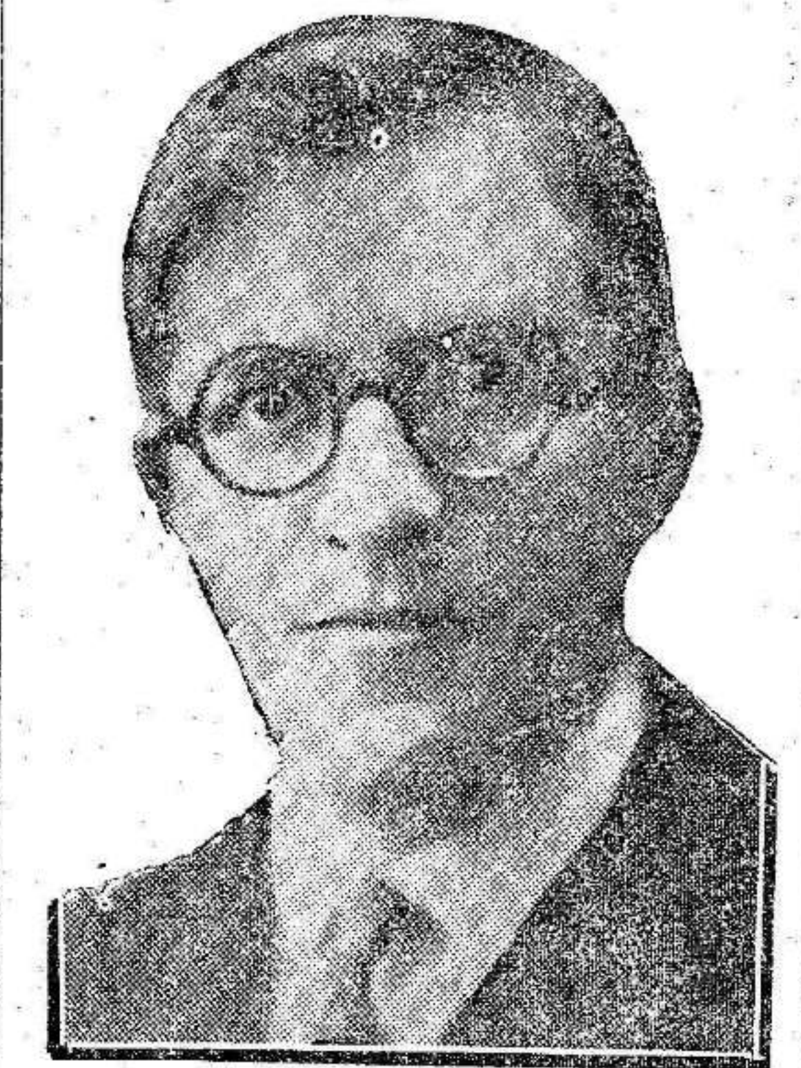
Don Julio Alvarez del Vayo, socialista, diputado a Cortes electo por Madrid (capital)