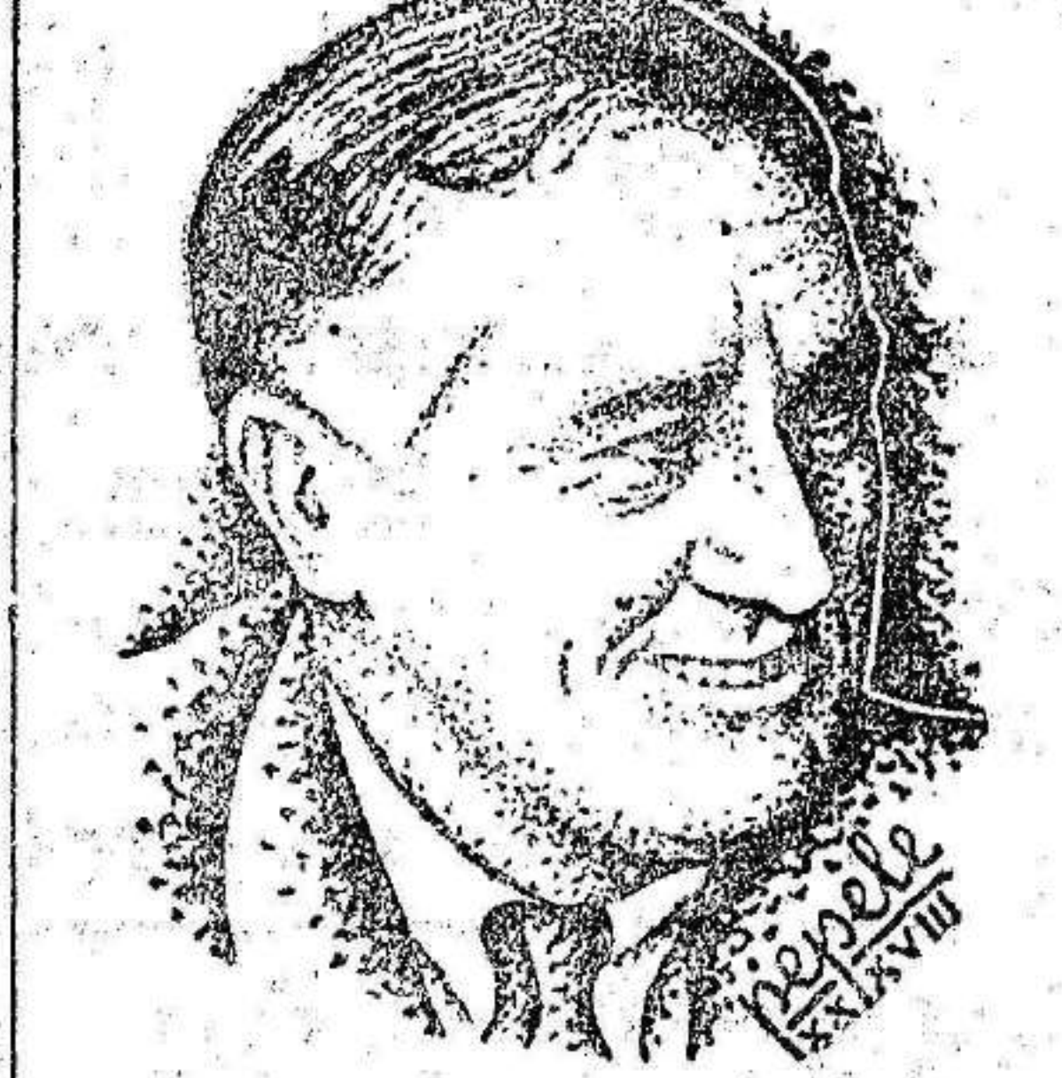
El jefe del Estado

sistiendo las tropas españolas, la presión enemiga. La artillería italiana actuó intensivamente sobre nuestras líneas. La aviación extranjera ha bombardeado la carretera Segorbe-Sagunto e ininterrumpidamente durante cuatro horas, la zona de Begós-Torás y Sureste de Pina. También agredió los pueblos de Algimia y Almonacid. CENTRO.—En las inmediaciones del palacete de la Moncloa fué volada una mina que causó al enemigo duro quebranto. Una contramina rebelde hizo explosión, originando muchas bajas y daños en sus propias filas. En los demás frentes, sin novedad. AVIACION Durante la jornada de ayer la aviación de los invasores bombardeó repetidamente Sagunto. También fué agredido Alicante por cinco trimotores "Savoia", ocasionando víctimas en la población civil. A las 8'46 minutos de hoy, diez trimotores italianos bombardearon Badalona, y poco antes de mediodía cinco trimotores "Savoia" han agredido, desde gran altura, Castelfelfs y las inmediaciones del hospital de Sitges, hiriendo gravemente a dos niños.