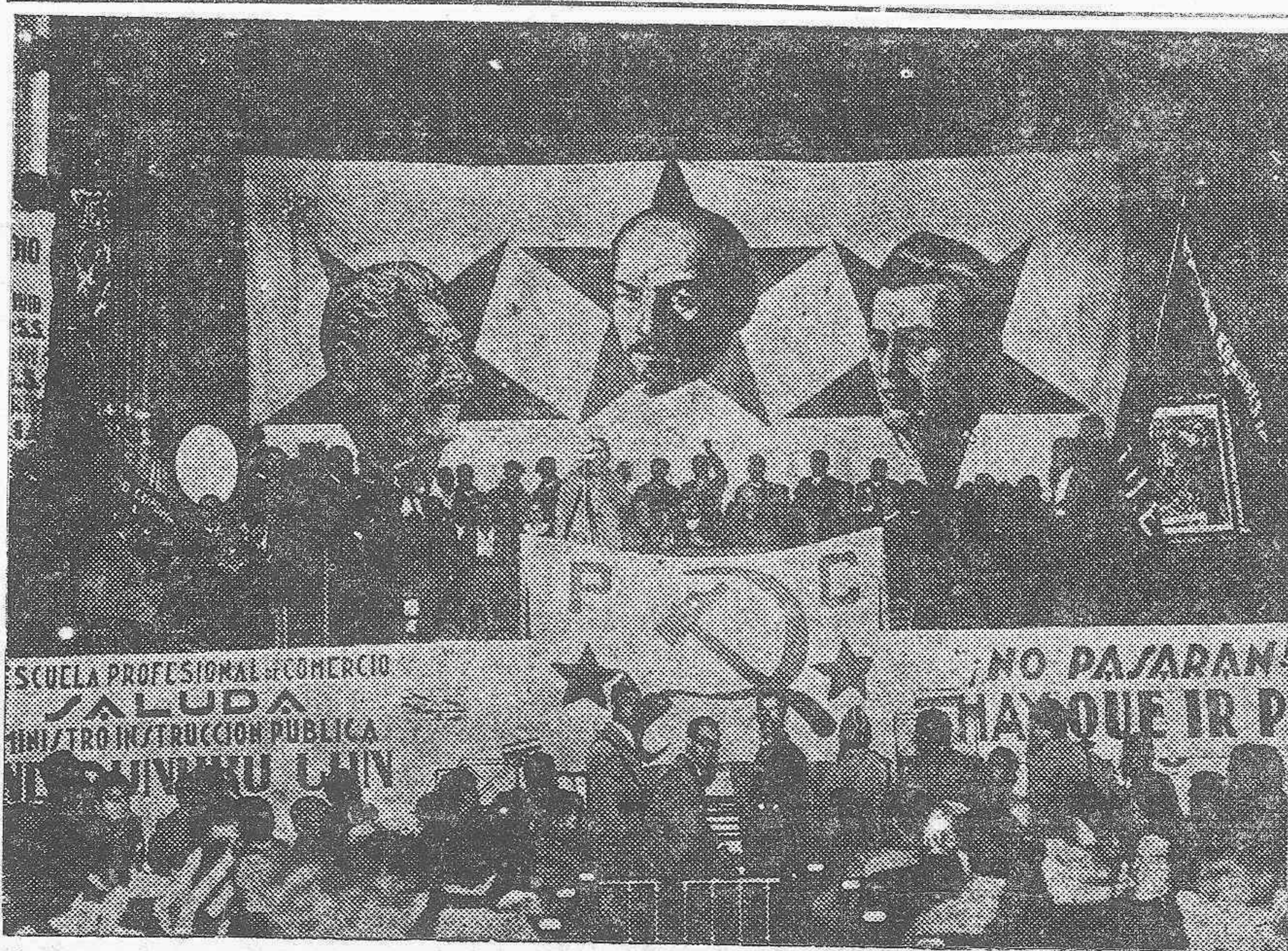
Aspecto del escenario del Teatro-Circo Villar, durante el grandioso mitin celebrado el domingo por el Partido Comunista con participación del ministro de Instrucción Pública.