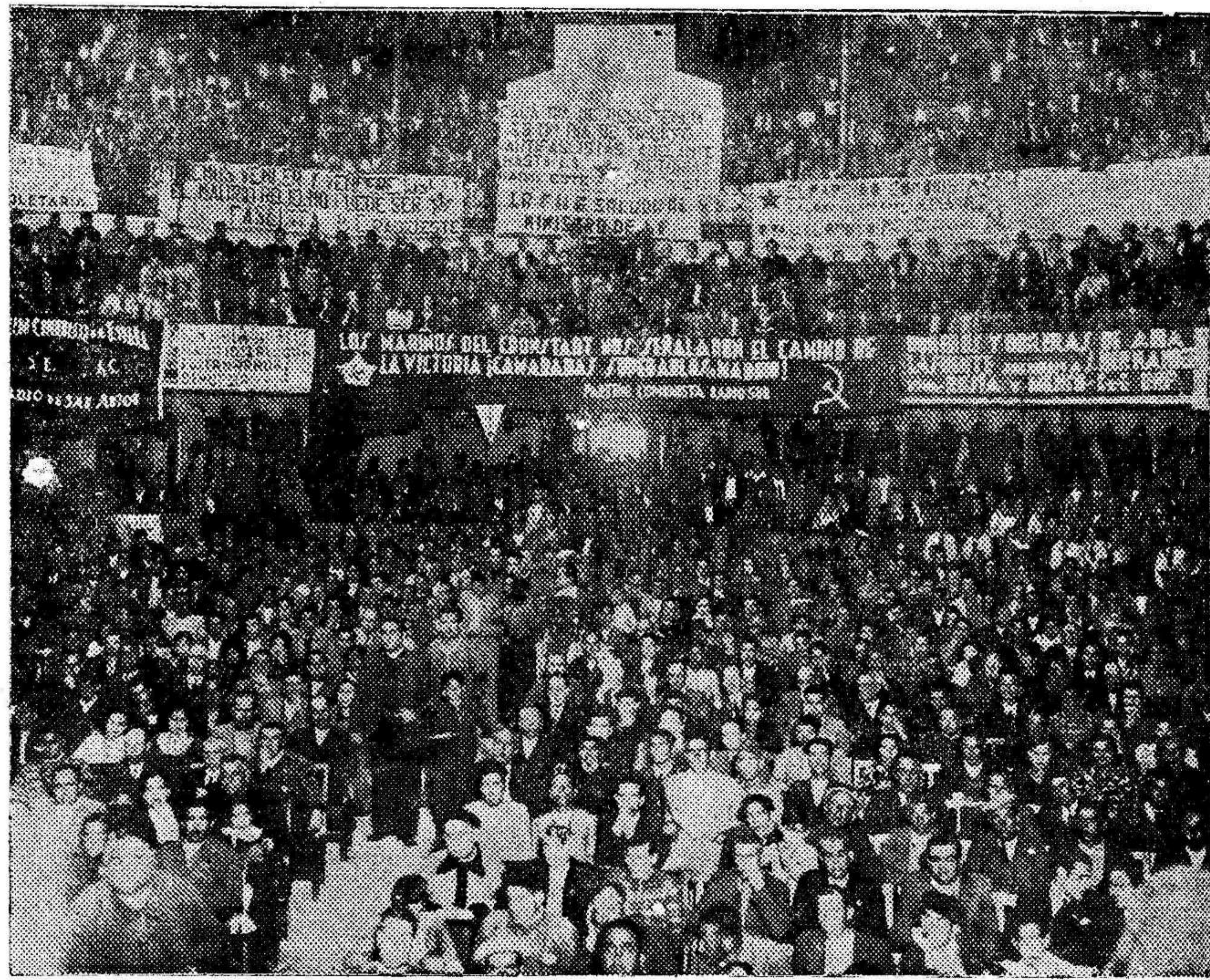
Una vista de la sala del Teatro-Circo Villar, durante el grandioso acto del pasado domingo, en el que intervino elocuentemente el ministro de Instrucción Pública, camarada Jesús Hernández.

A continuación dice que cuando Martínez Barrio visitó Alicante le escribió una carta solicitando de él una entrevista. En contestación le visitó el se-