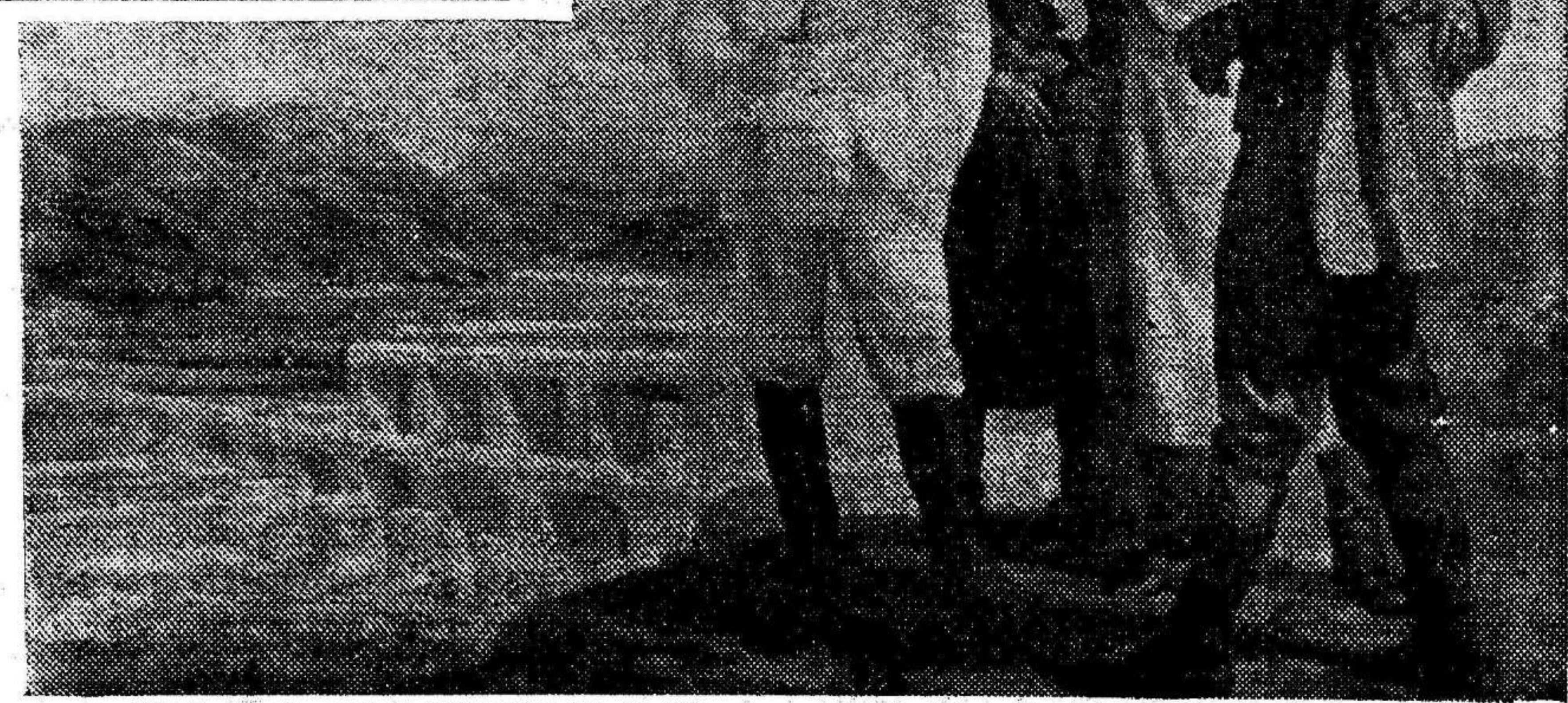
"Stalin en la central hidroeléctrica de Rion, cerca de Koutais. (Georgia)". Cuadro de Ir. Toidzé.

Las radios facciosas, los esplotados de la quinta columna y las gentes hipócritas propicias a todos los colores y a todos los chillidos han clamado ayer y hoy en fuero redoblando los gases tóxicos del derrotismo y de la mentira. Contra esa ofensiva tenemos que movilizarnos con el antiguo de la verdad. La verdad es dura, pero no es venenosa. En Oviedo luchamos cada vez con mayor vestidura. Esa es la verdad. Y venceremos. En los frentes del Centro luchamos con alternativas. Si en algún punto se han producido pasajes desafortunados, en todo el resto de la línea se ha rechazado al enemigo. Nuestros soldados no han cedido terreno y han contraatacado con dureza. Esa es la verdad. Y cada vez es mayor la resolución de vencer o morir en la contienda. Y VENCEREMOS. (De "Claridad".)