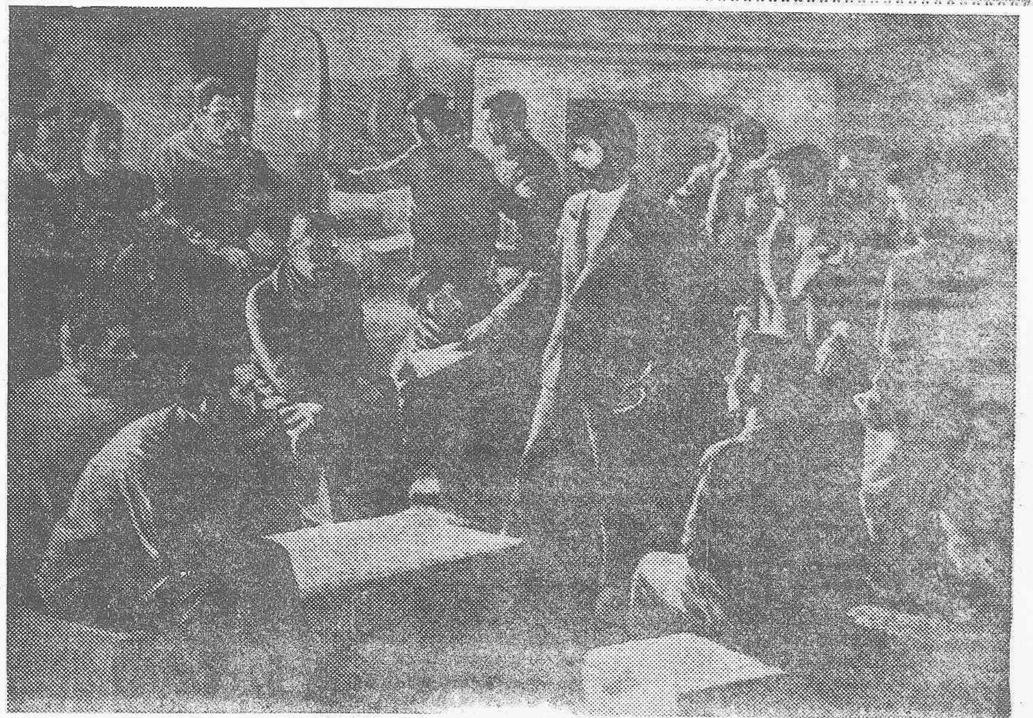
Reunión regional de los comunistas, en residencia de la Comandancia de Huesca (1936). Cuadro de A. Gijouacivil.

Los rebeldes se replegaron al poblado, abandonando cinco automóviles.