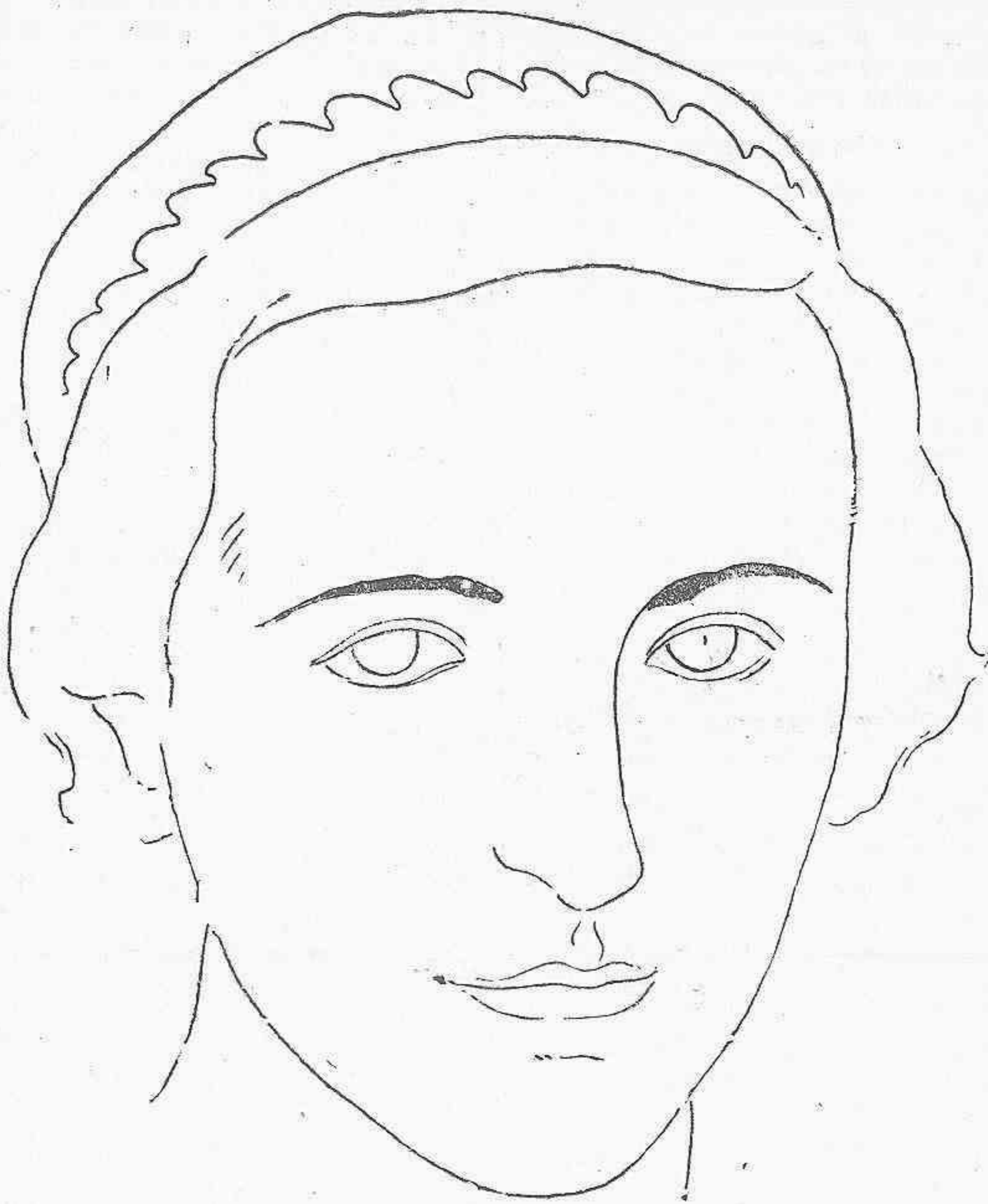
LINA ODENA (Dibujo de Garay)

El 5.º Regimiento de Milicias populares desea a los valientes reclutas de los reemplazos de 1933, 1934 y 1935, conquisten un puesto digno en la lucha actual contra la barbarie fascista. Y espera de vosotros que, si llega el momento, sabréis dar generosamente vuestra sangre, como ya la están dando millares y millares de antifascistas y las heroicas fuerzas leales al Gobierno del pueblo, al Gobierno de la victoria.—Comandancia de Murcia del 5.º Regimiento de Milicias Populares.