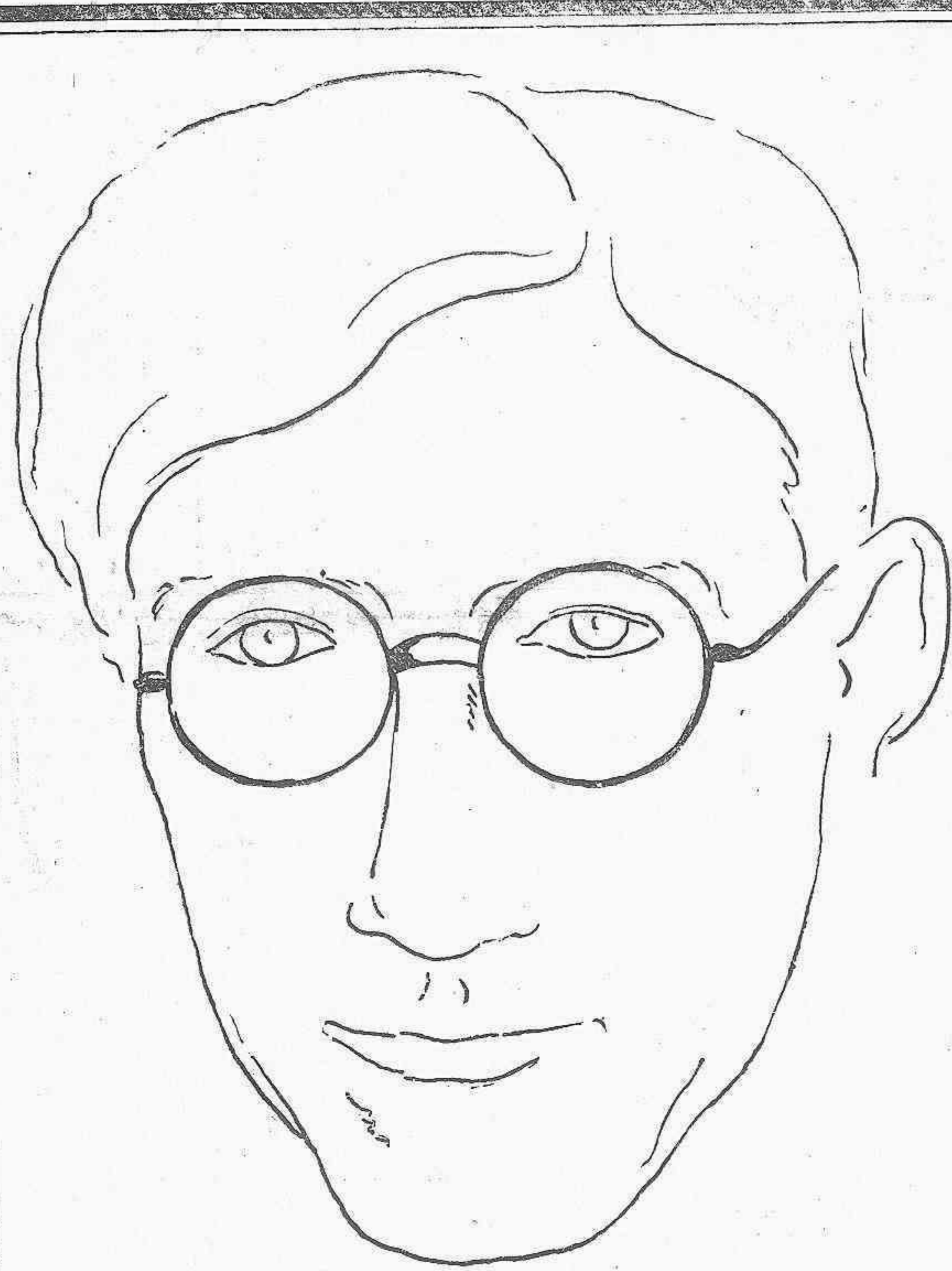
JULIO ALVAREZ DEL VAYO, ministro de Estado (Dibujo de Garay)