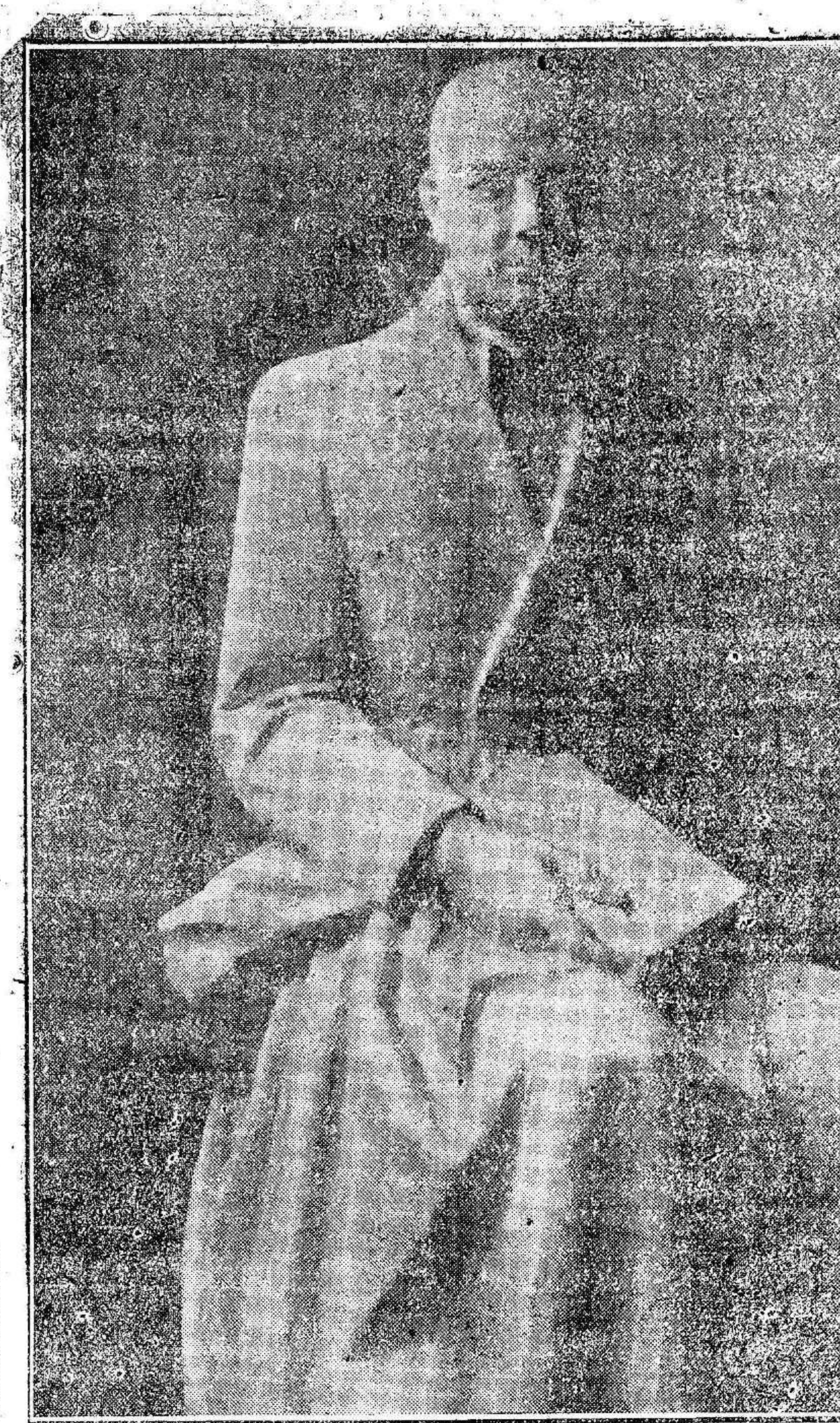
La estatua de Jara Carrillo erigida en el jardín de Floridablanca