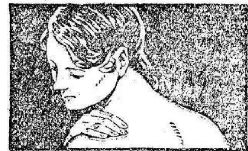
ALIVIA EL DOLOR DE TORCEDURAS Y DISLOCACIONES