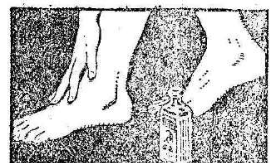
NO IRRITA NI CAUSA LA MENOR MOLESTIA

Dolores reumáticos, cático, lumbago, resfriados, contusiones, torticolis, torceduras, toda clase de dolores musculares, desaparecen aplicando suavemente, sin frotar, el Linimento de Sloan.