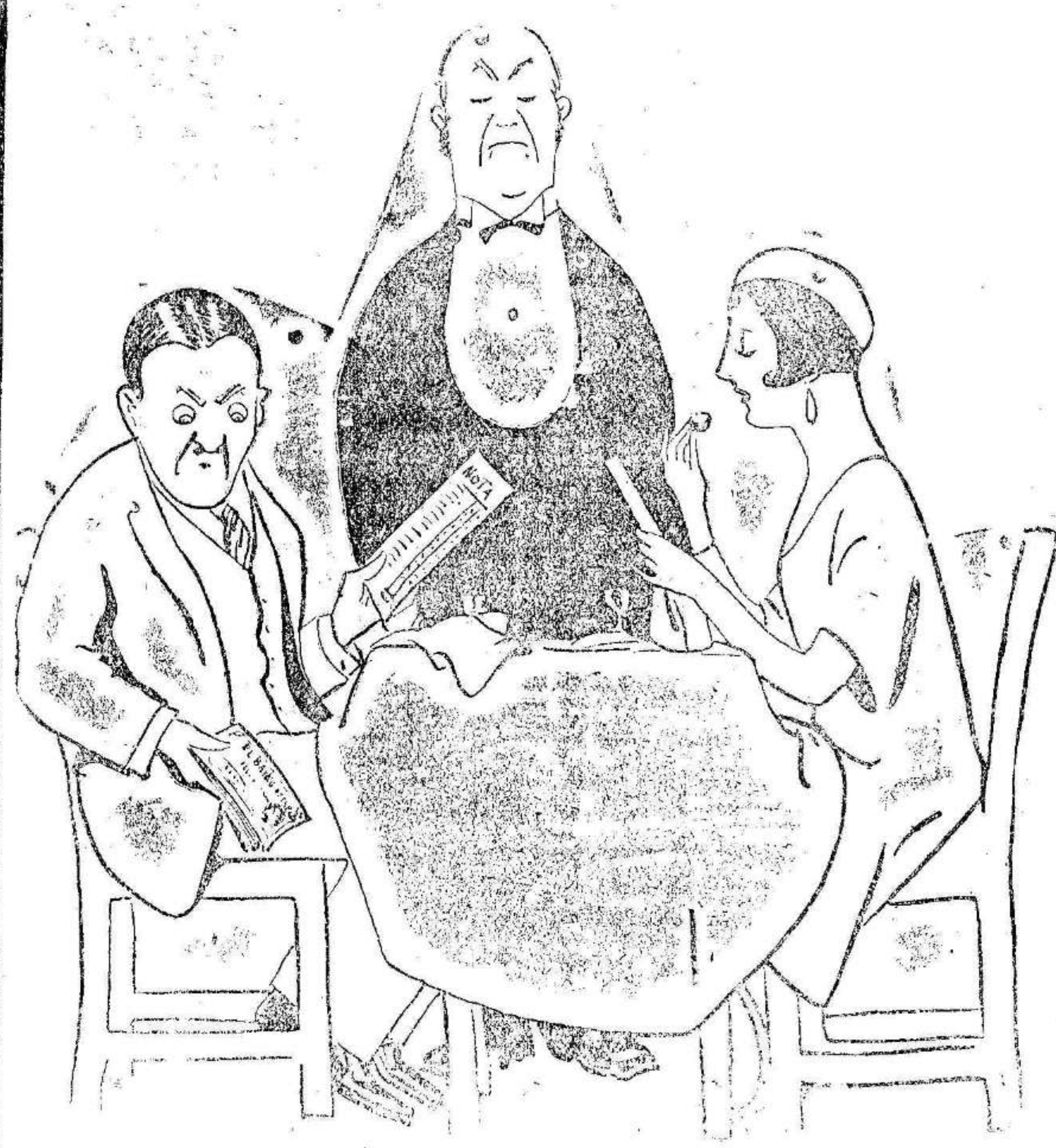
LA INVITACION A CENAR

Santoral.—Día 3 de Agosto de 1933.—Jueves.—La Invencción del Cuerpo de San Esteban.—San Nicodemus, obispo.—Santas Ciria y Lidia.—San Eufreasio.