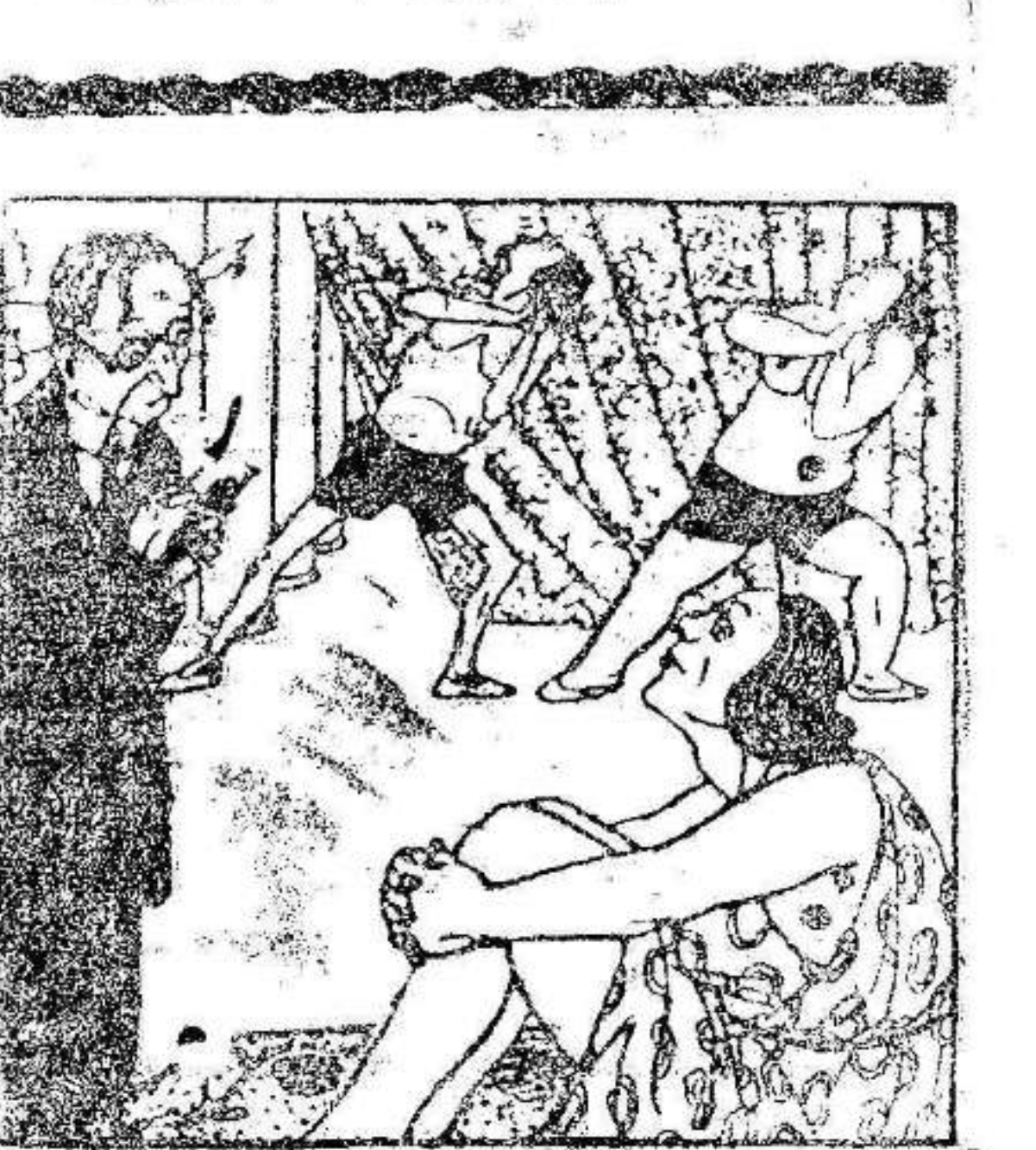
EL PROFESOR Y LAS BAILARINAS

—Señoritas, no olviden que pueden bailar sin piernas; pero no sin una concepción filosófica del Cosmos.