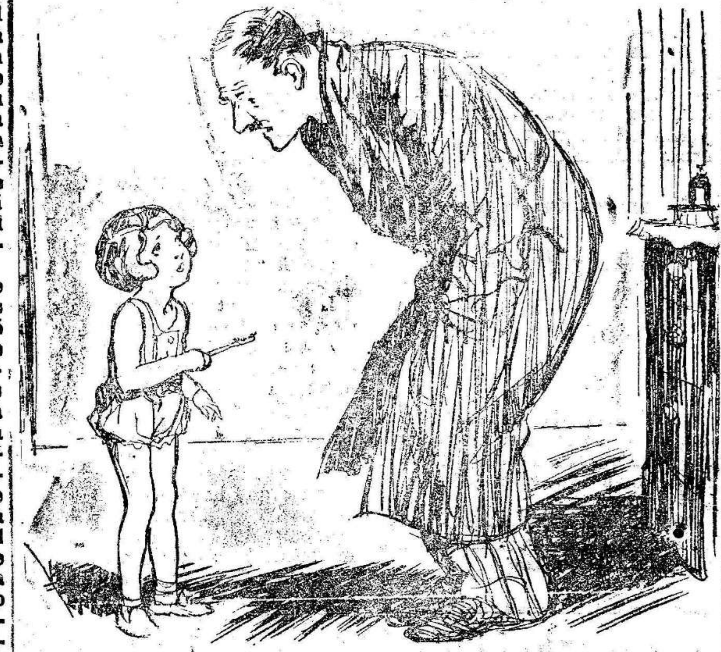
El niño.—Papá, venga a pedir un poquito del regenerador tuyo del cabello, porque se le ha caído los pelos a mi cepillo.

Un almuerzo a los periodistas 26, a las 11 n. Madrid.—El ministro de Agricultura ha obsequiado hoy a los periodistas que hacen información en su departamento y a los que la hacían en el de Instrucción pública durante su actuación, con un almuerzo. El acto resultó muy cordial. ANUNCIO DE HUELGA Los estudiantes de la F. U. E. no entrarán en clase el lunes 26, a las 11 n. Madrid.—Los estudiantes pertenecientes a la F. U. E. han acordado hoy declarar la huelga durante cuarenta y ocho horas, a partir del lunes próximo, por solidaridad con sus compañeros de la Escuela de Ingenieros industriales. El motivo de esta actitud es el no haber sido aún aceptadas las proposiciones de estos estudiantes, que hace dos meses presentaron al Gobierno: Estas son: