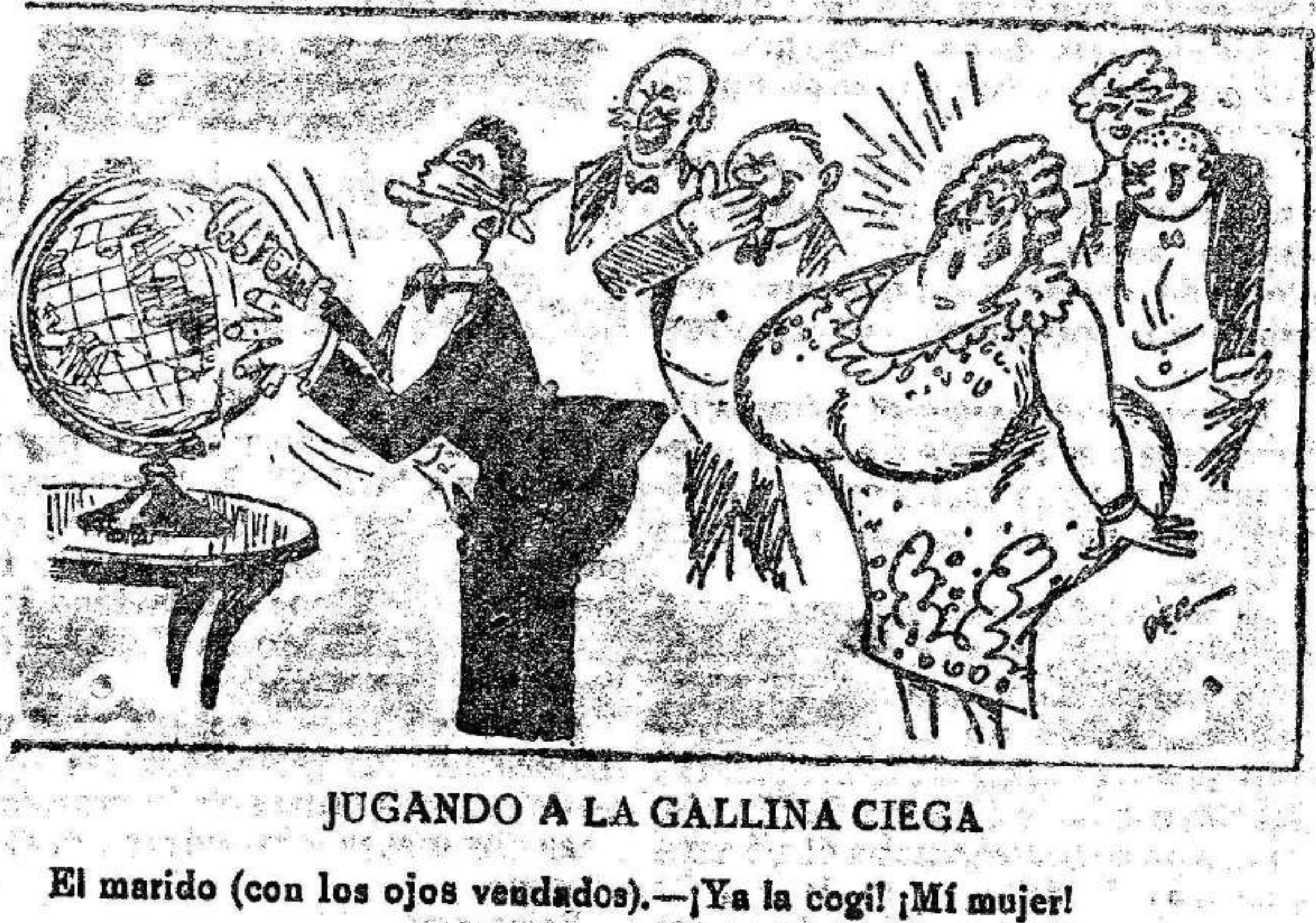
JUGANDO A LA GALLINA CIEGA El marido (con los ojos vendados).—¡Ya la cogí! ¡Mí mujer!

EL LIBERAL puede adquirirse diariamente, en LORCA. Canalejas, 62. MADRID. Kioscos Puerta del Sol y calle de Alcalá ALICANTE. Casa de la Prensa, San Fernando, 32. ALBACETE. Kiosco Moreno, Paseo de Alfonso XII. BARCELONA. — Kiosco Carmen Rambla de las Flores, frente calle Carmen. CARTAGENA, en el Kiosco Victoria, en las Puertas de Murcia, y en el Kiosco de la calle Mayor, frente a Café Excelsior. VALENCIA. Kiosco Río de la Plata, calle Barcas, 6. Lea usted EL LIBERAL