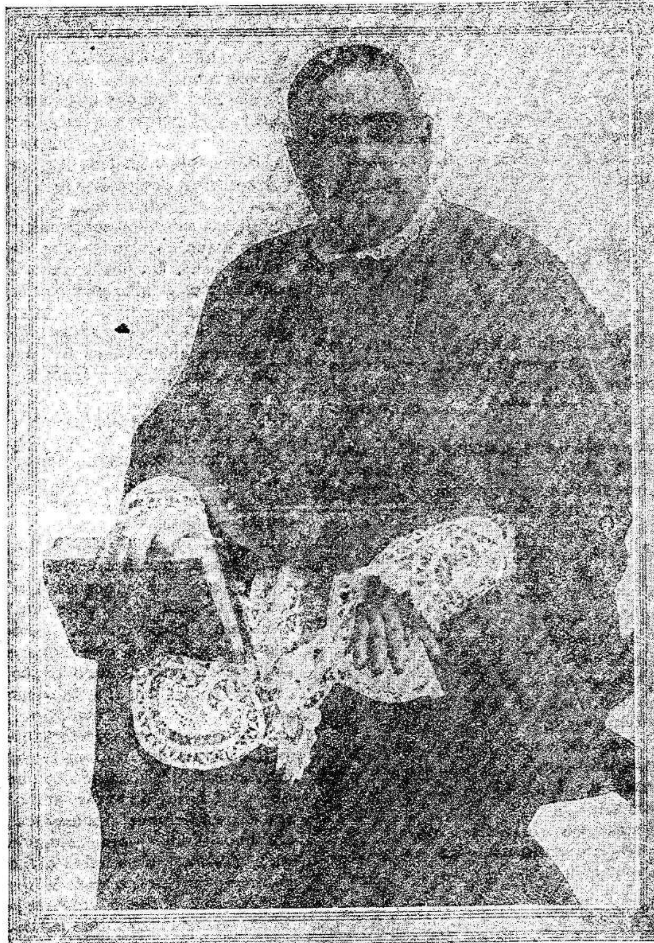
El Ilustrísimo señor don Francisco Frutos Valiente

Posteriormente, se nos aseguraba desde la capital salmantina, que el fúnebre acto se verificará el jueves, prometiendo ser una enorme manifestación de sentimiento, dadas las muchísimas simpatías y afectos que el finado había logrado alcanzar en la diócesis de su gobierno.