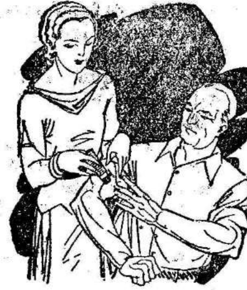
Dolor en las articulaciones Calambres