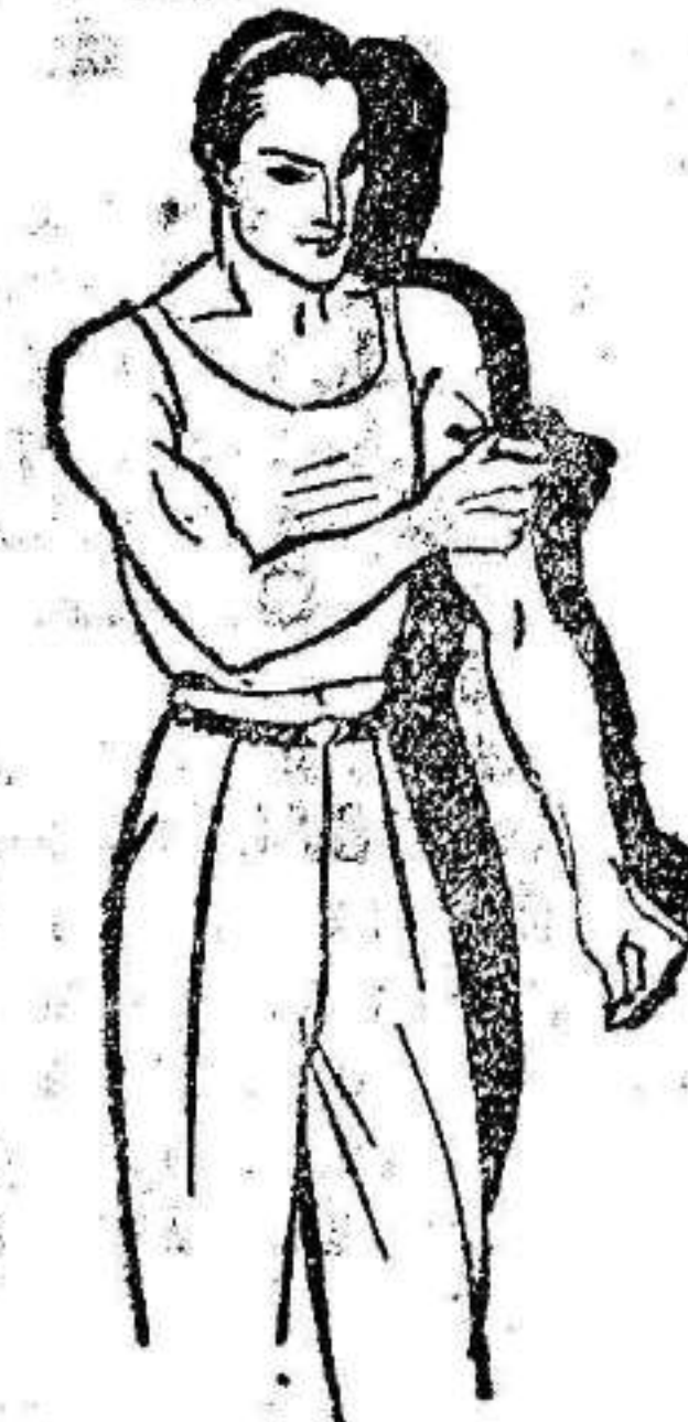
Fatiga muscular Golpes-Torceduras