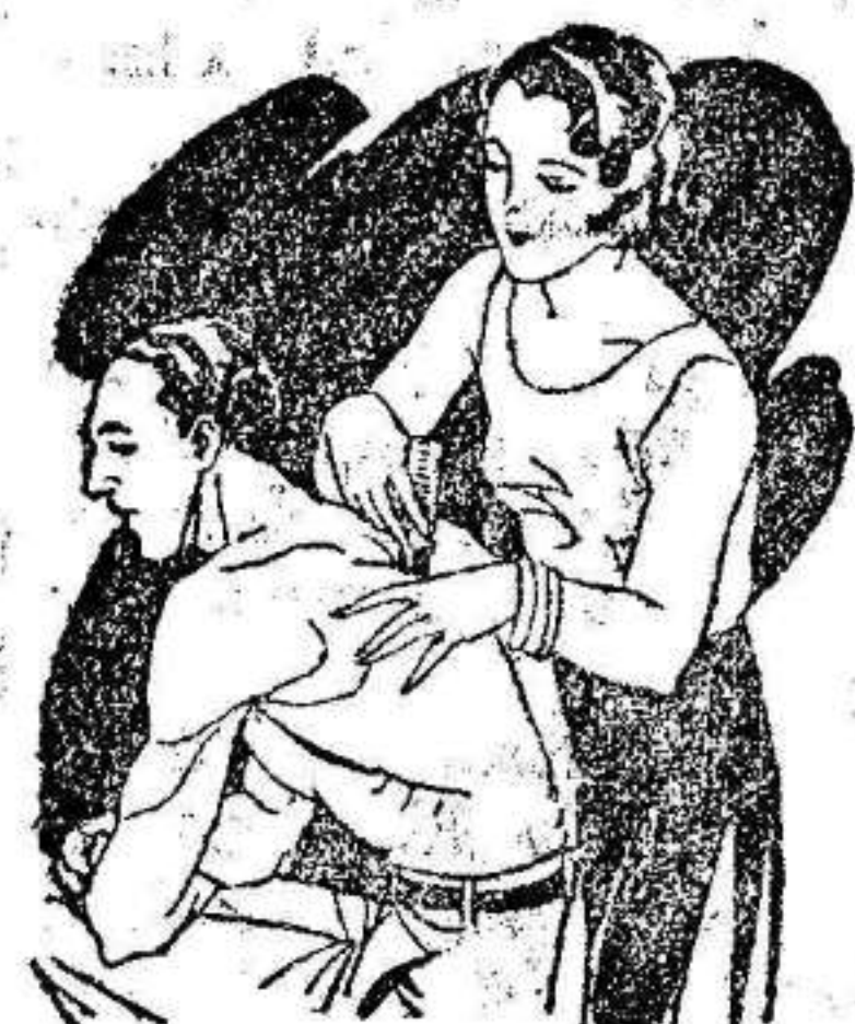
Artritis Dolors de muñeca y brazos Dolors de espalda y riñones

El LAPIZ TERMOSAN se vende en todas las Farmacias y Centros de Especificos Tubo grande; 4.45 ptas. - Tubo pequeño; 3. - ptas., timbres incluidos