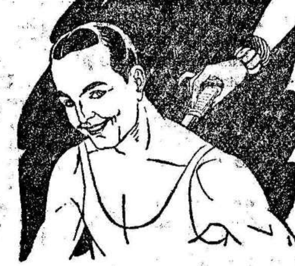
Rigidez del cuello Torticollis