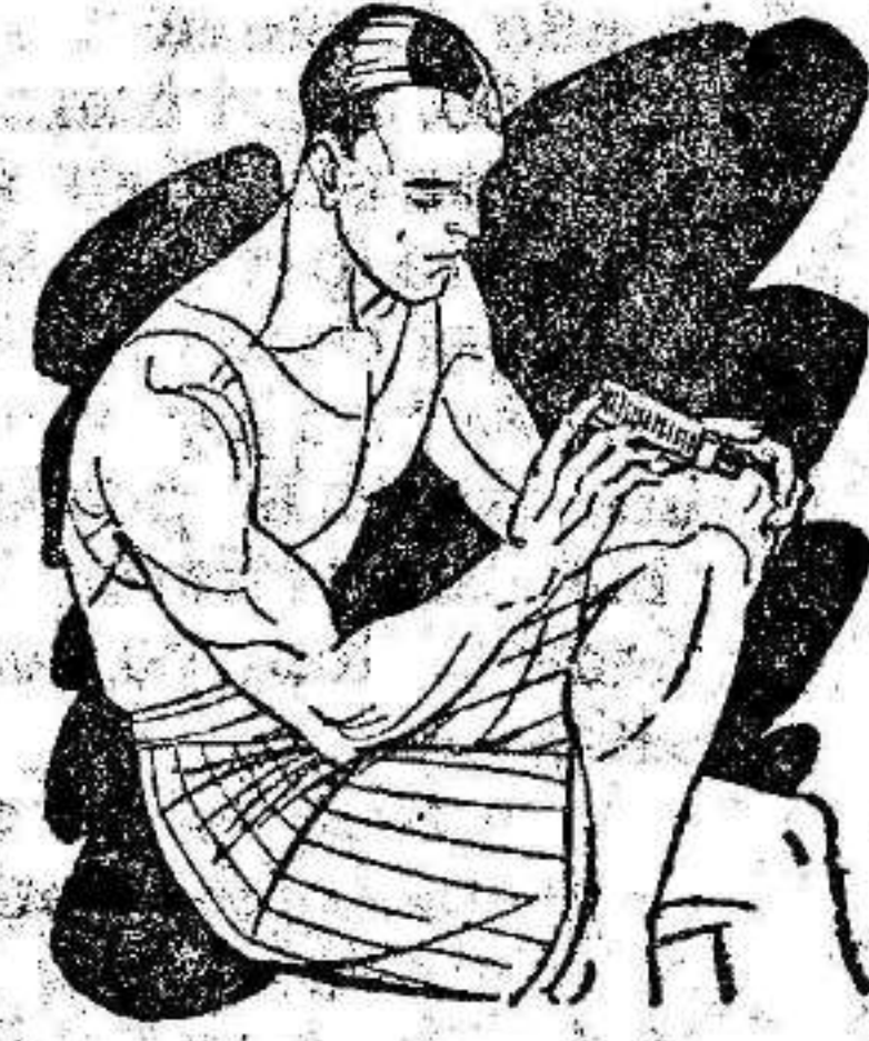
Reuma - Clática Golpes

El LAPIZ TERMOSAN es el Revulsivo más práctico y eficaz contra toda clase de dolores y congestiones.