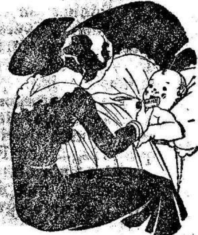
Tos - Catarros - Bronquitis Congestiones