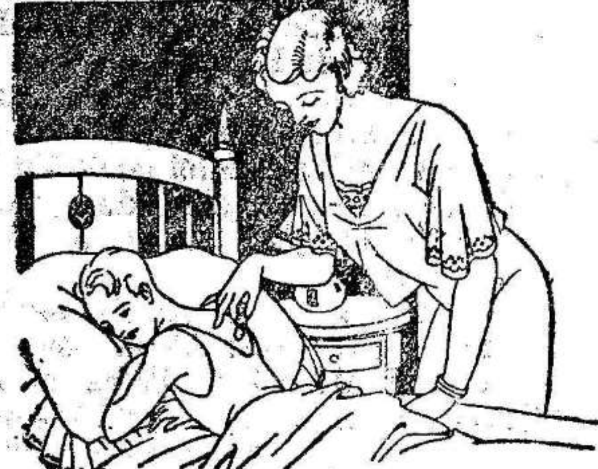
Resfriados - Asma - Pleuresias Congestión pulmonar