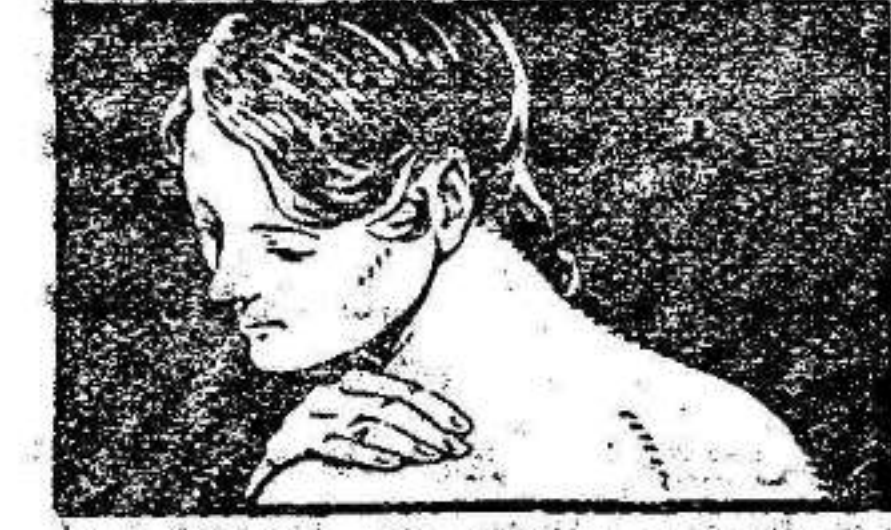
ALIVIA EL DOLOR DE TERCEDURAS Y DISLOCAMIENTOS