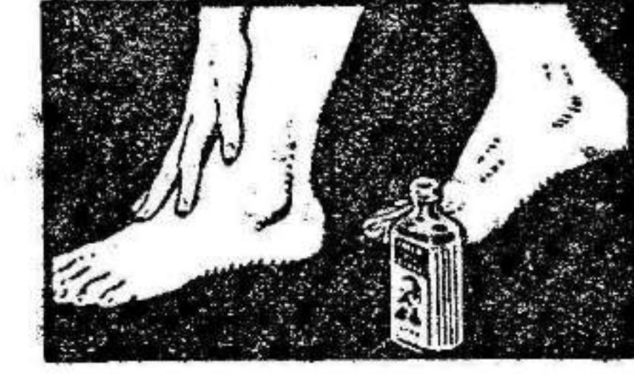
NO IRRITA NI CAUSA LA MENOR MOLESTIA

No mancha. Reaviva la circulación de la sangre. Calma y produce bienestar. Para evitar posibles sufrimientos tenga en casa un frasco a mano, porque el dolor aparece sin avisar.